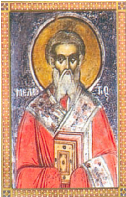
Ἅγιος Μελέτιος Αρχιεπίσκοπος Αντιοχείας