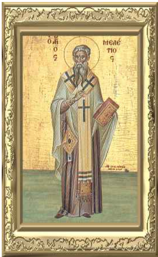
Άγιος Μελέτιος Αρχιεπίσκοπος Αντιοχείας