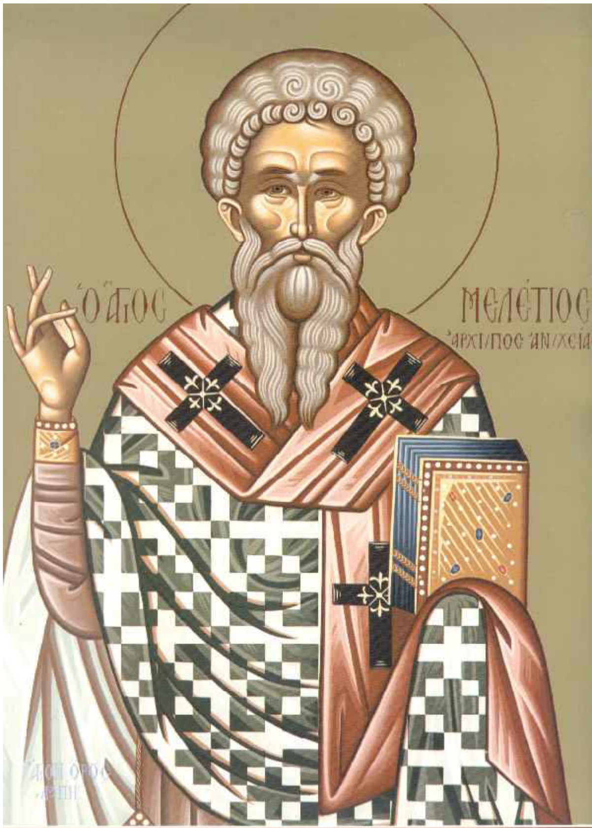
Άγιος Μελέτιος Αρχιεπίσκοπος Αντιοχείας

Εορτάζει στις 12 Φεβρουαρίου εκάστου έτους.