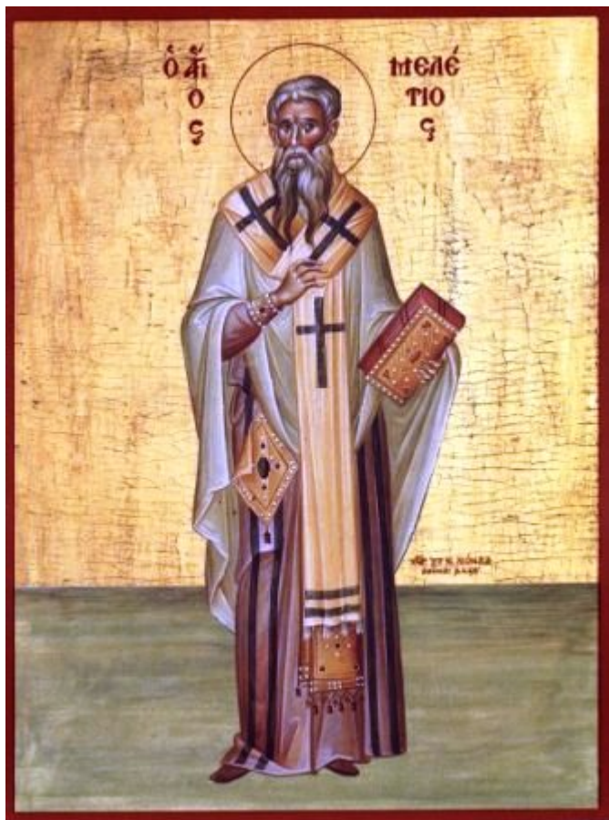
Άγιος Μελέτιος Αρχιεπίσκοπος Αντιοχείας