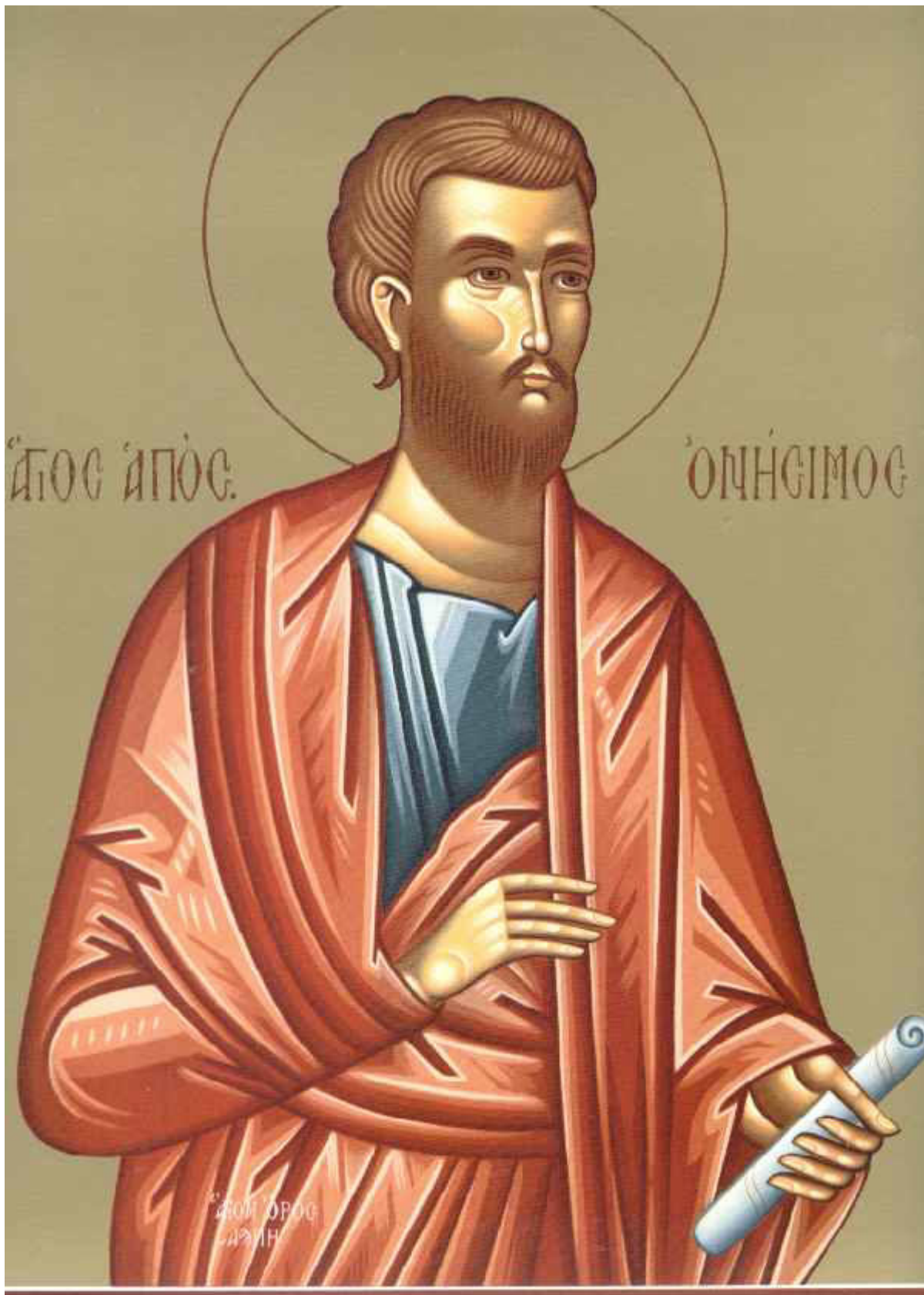
Άγιος Ονήσιμος ο Απόστολος