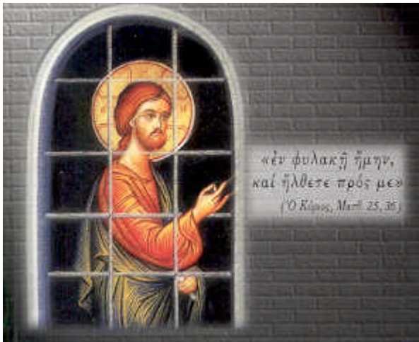
Ἅγιος Ονήσιμος ο Απὸστολος