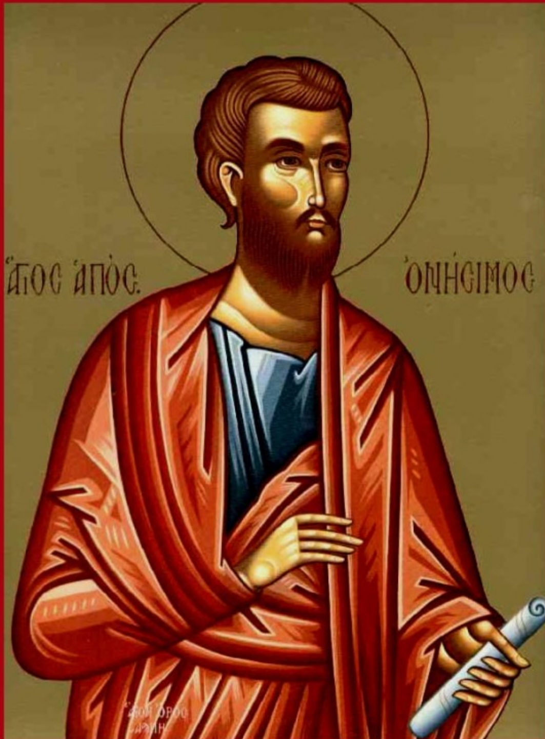
Άγιος Ονήσιμος ο Απόστολος

Εορτάζει στις 15 Φεβρουαρίου εκάστου έτους.