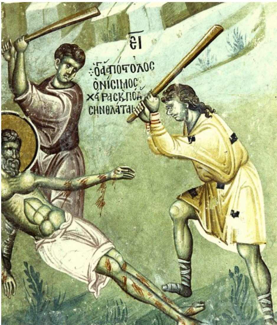
Ἅγιος Ονήσιμος ο Απὸστολος