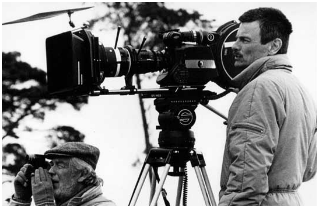
Αντρέι Ταρκόφσκι, ( www.andrei-tarkovsky.com )