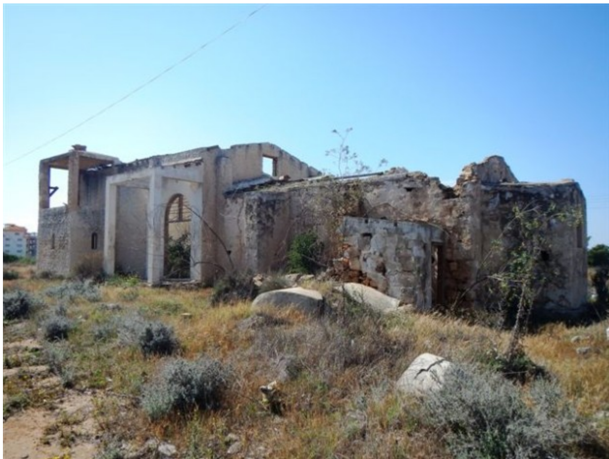
Νοτιοανατολική όψη του Αγίου Παντελεήμονος