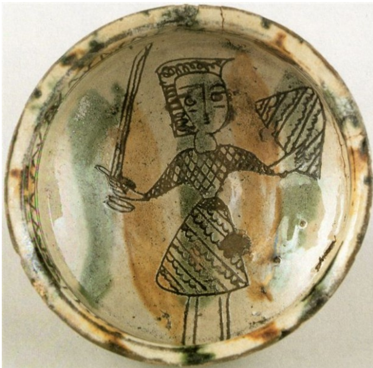
Εφραλωμένη κούπα με παράσταση ιππότη, τέλος 14ου αιώνα από τη συλλογή Πιερίδη.