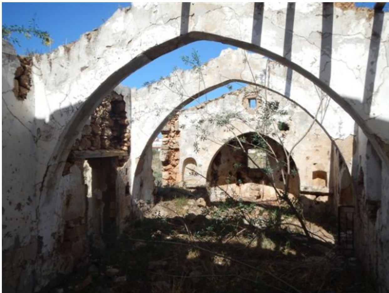
Το εσωτερικό του ναού του Αγίου Παντελεήμονος από δυτικά