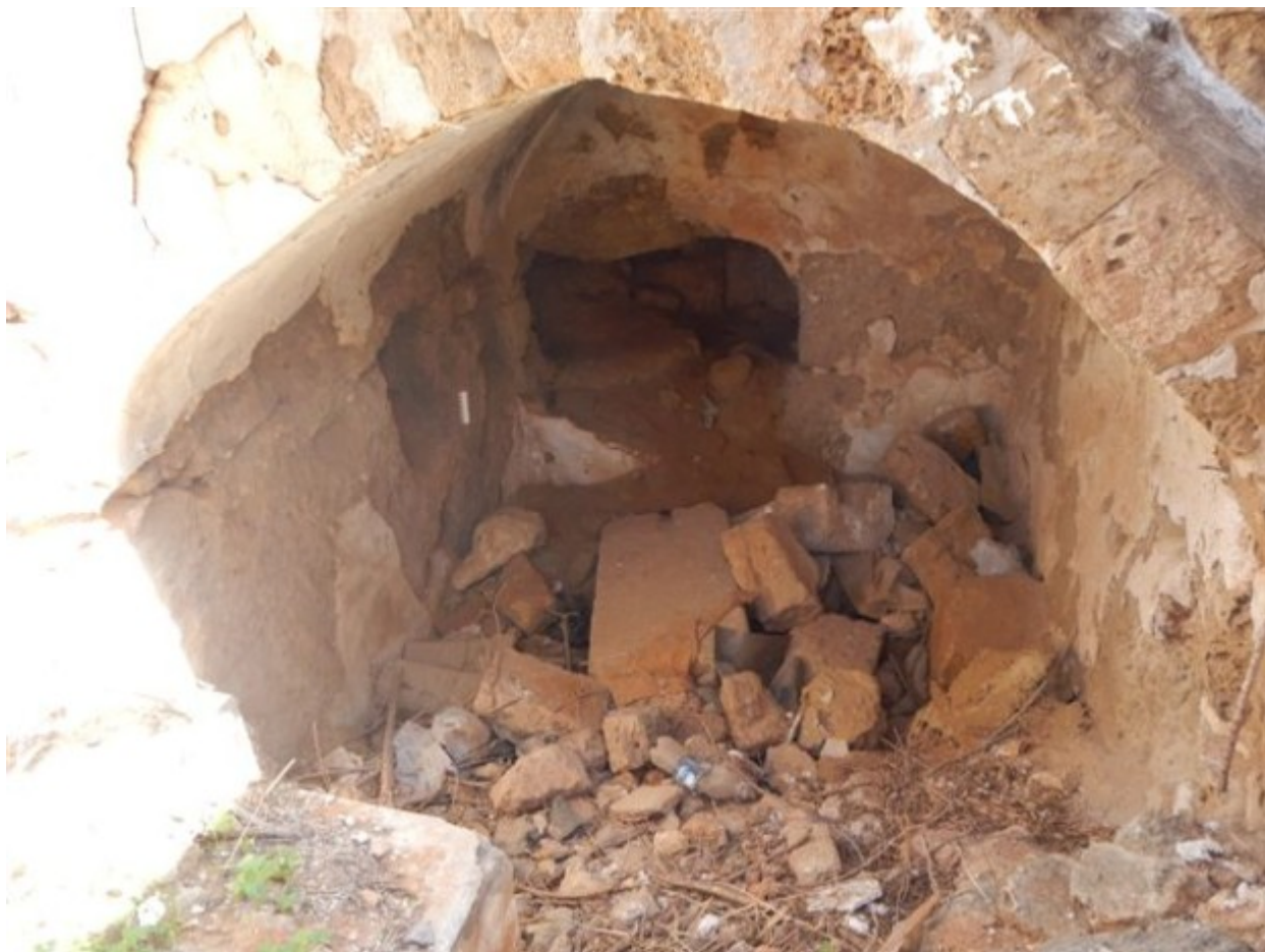
Το υπόγειο αγίασμα-τάφος στο ναό του Αγίου Παντελεήμονος