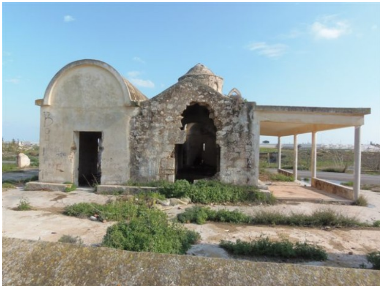
Δυτική όψη του Αγίου Γεωργίου του Φαράγγου