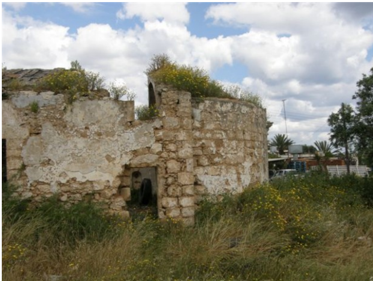
Η ανατολική πλευρά του ναού της Αγίας Παρασκευής (16ος αιώνας)