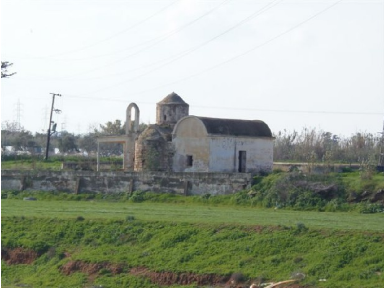
Βορειοανατολική όψη του Αγίου Γεωργίου του Φαράγγου (12ος αιώνας)

ΝΕΑ ΑΡΧΑΙΟΛΟΓΙΚΑ ΕΥΡΗΜΑΤΑ ΣΕ ΝΑΟΥΣ ΤΗΣ ΑΜΜΟΧΩΣΤΟΥ (ΒΑΡΩΣΙΩΝ): ΑΓΙΟΣ ΓΕΩΡΓΙΟΣ ΦΑΡΑΓΓΟΥ, ΑΓΙΑ ΠΑΡΑΣΚΕΥΗ & ΑΓΙΟΣ ΠΑΝΤΕΛΗΜΩΝ