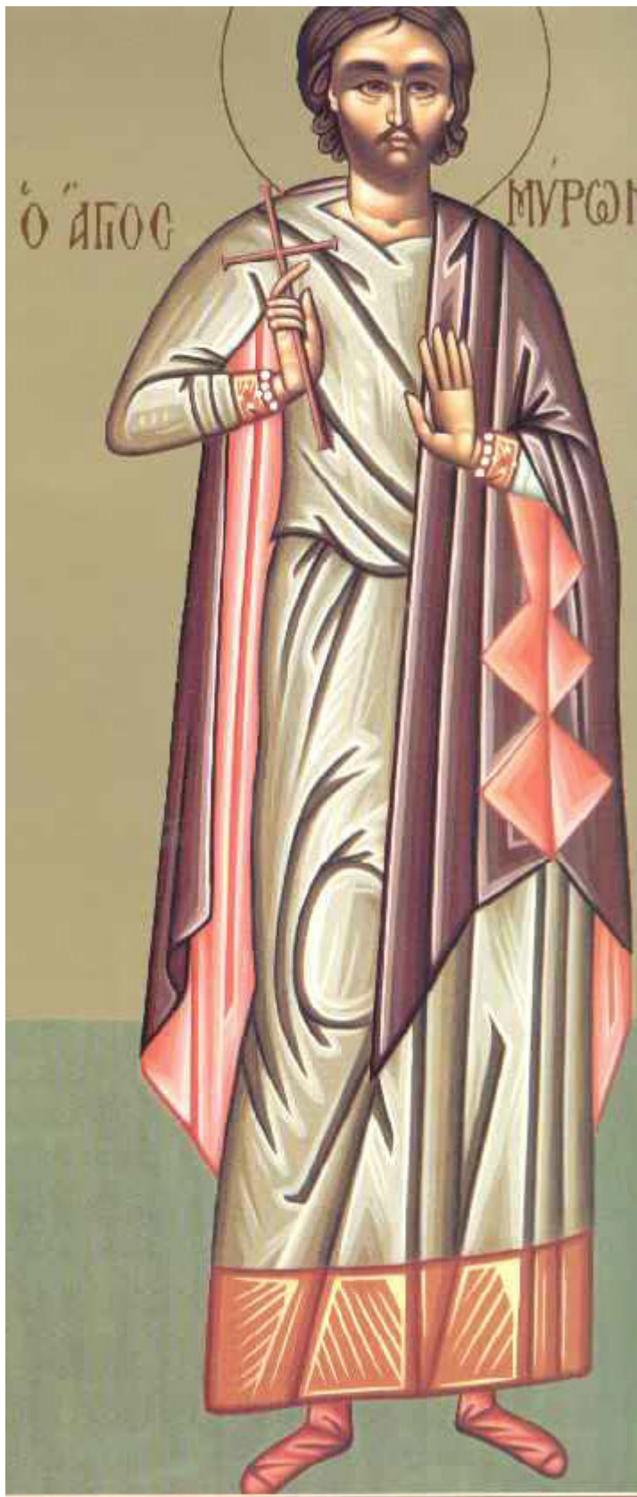
Άγιος Μύρων ο Νεομάρτυρας από το Ηράκλειο Κρήτης