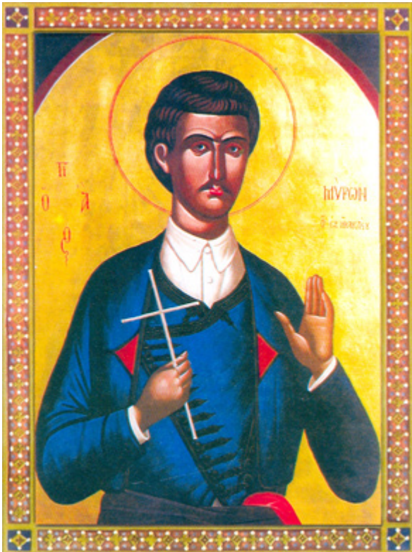
Άγιος Μύρων ο Νεομάρτυρας από το Ηράκλειο Κρήτης