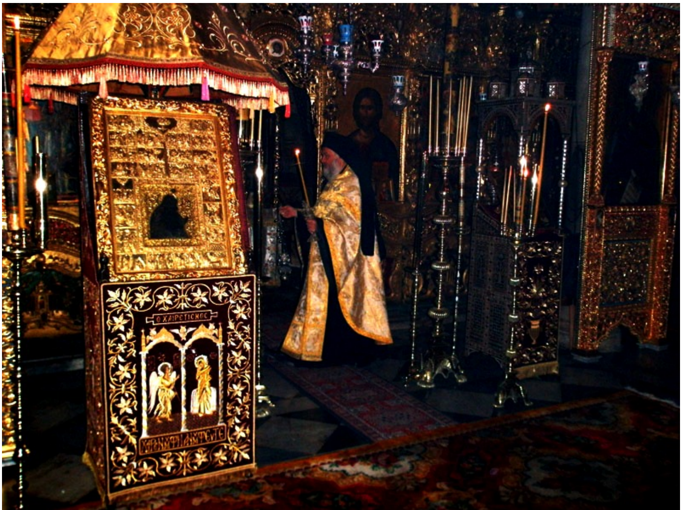
«Παναγία των Χαιρετισμών» Στη Μονή Διονυσίου του Αγίου Όρους