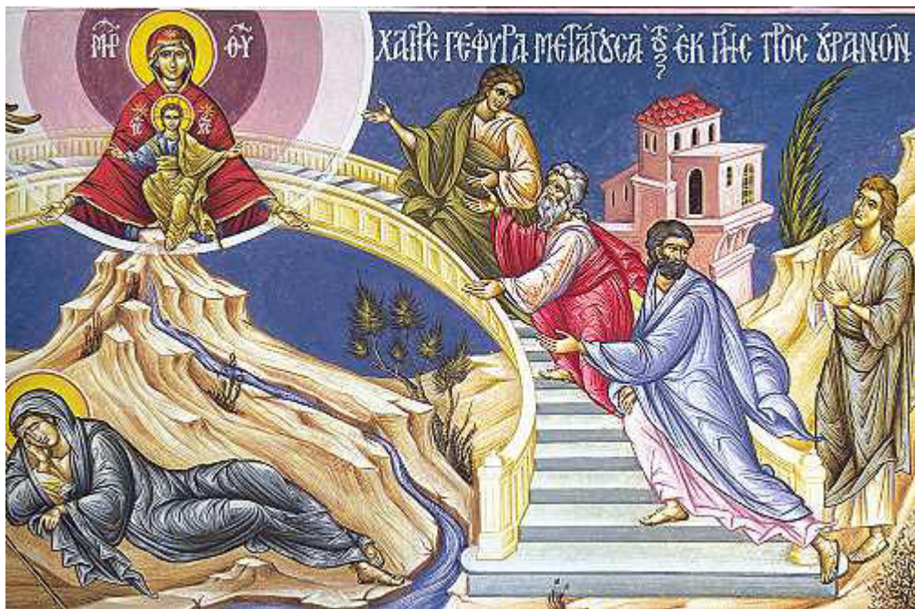
Χαῖρε, γέφυρα μετὰγουσα ἀπὸ γῆς πρὸς οὐρανόν....