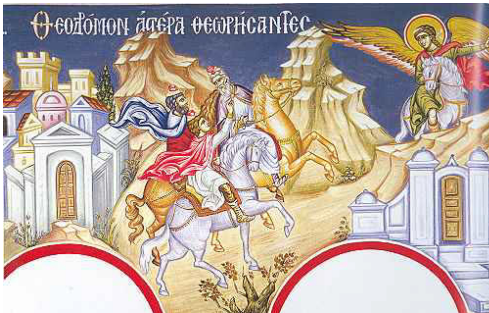
Θεοδρόμον ἀστέρα, θεωρήσαντες Μάγοι....