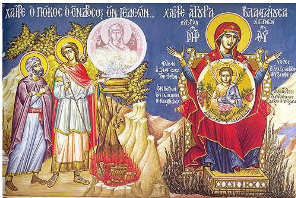
Χαῖρε, ἄρουρα βλαστάνουσα εὐφορίαν οἰκτιρῶν...