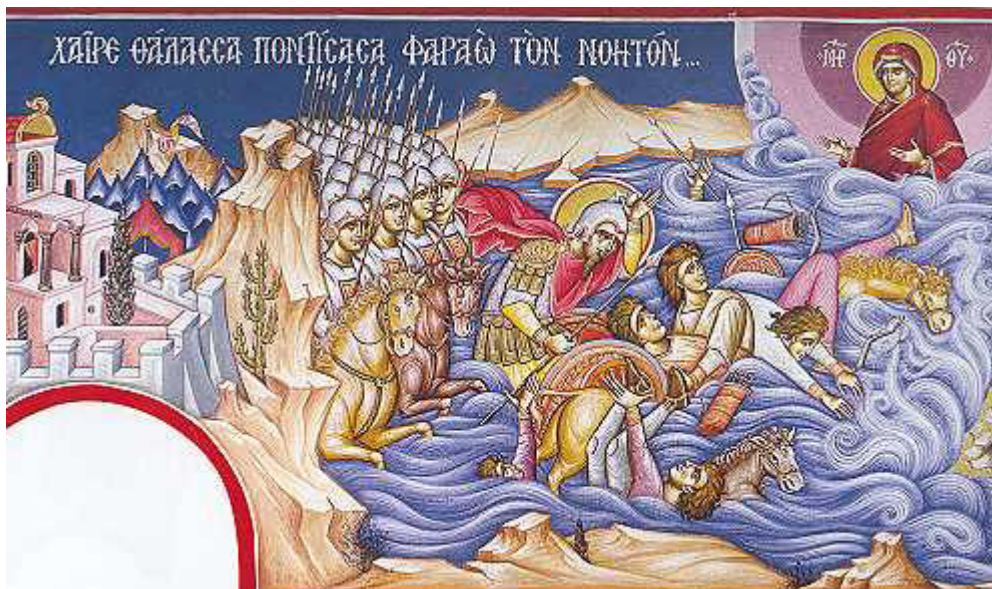
Χαίρε, θάλασσα ποντίσασα Φαραῶ τὸν νοητόν....