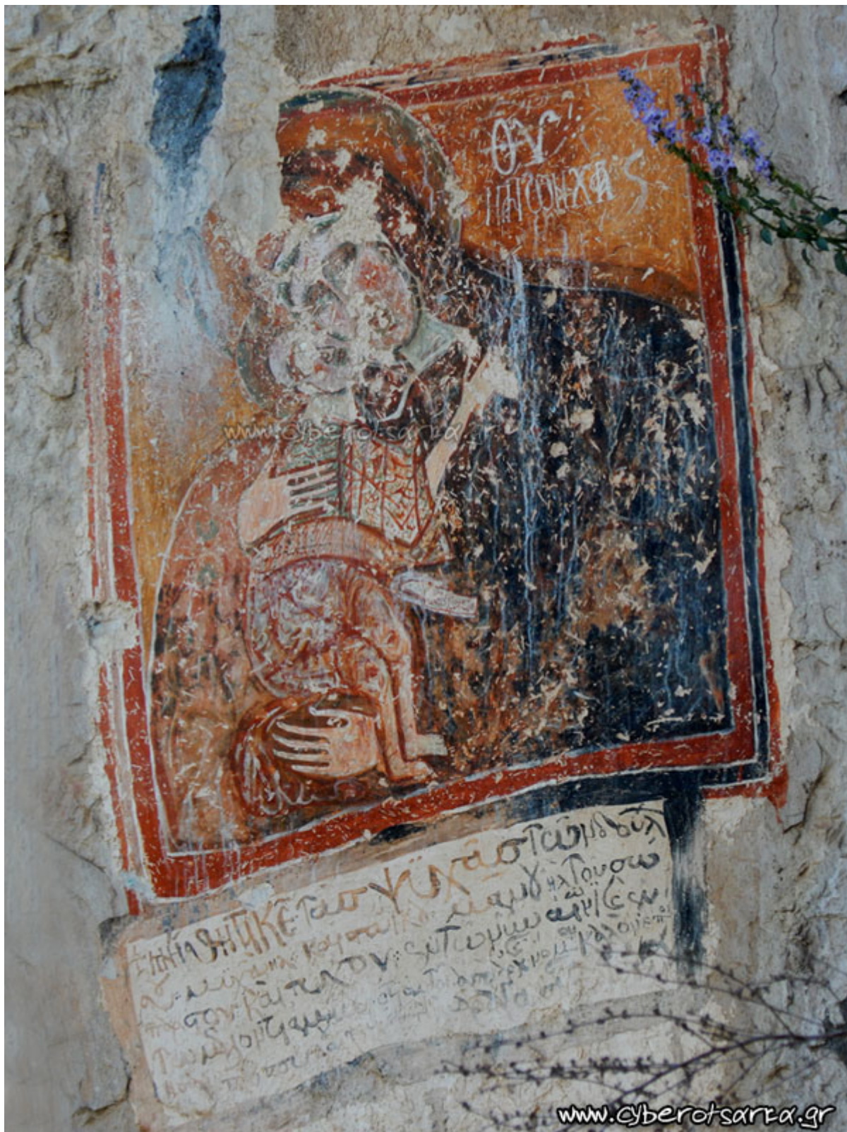
Η βραχογραφία της Παναγίας Δεξιοκρατούσας, δημιούργημα του 14ου αιώνα, βρίσκεται σε απόσταση περίπου 150 μέτρων μετά τη Βλαχερνίτισσα και η