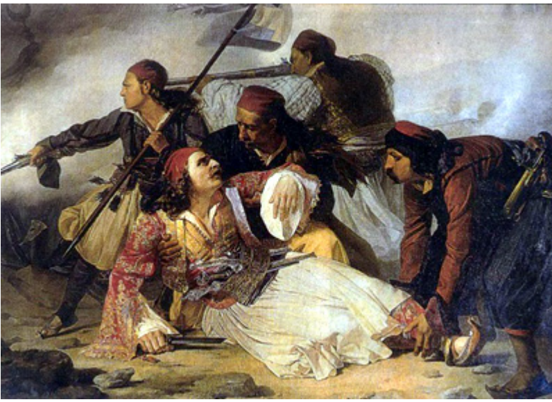
Το Μάρκο παν στην εκκλησιά, το