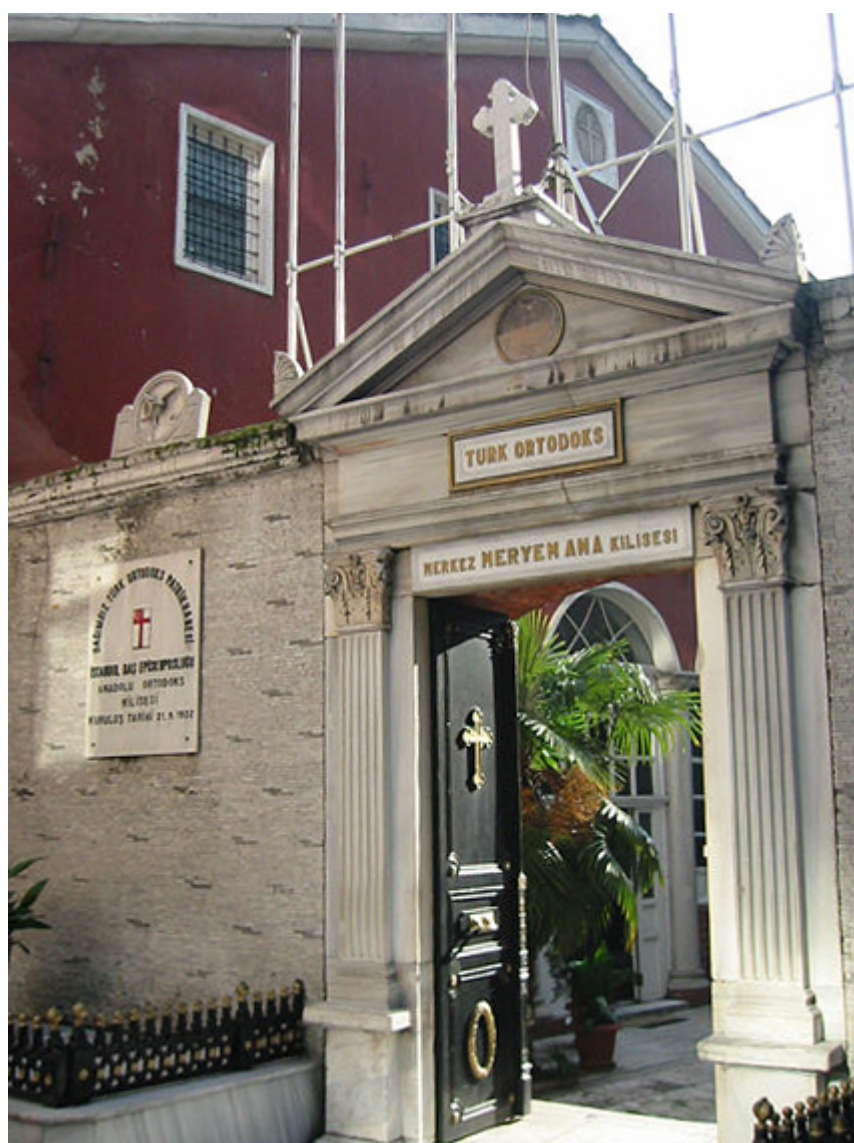
Το τουρκορθόδοξο Πατριαρχείο

Έτσι, τον Νοέμβριο του 1921 ο παπα-Ευθύμ δηλώνει διά του Τύπου ότι είναι Γενικός Επίτροπος των Τουρκορθόδοξων Χριστιανών και προχωρά στην ίδρυση αυτοκέφαλης Τουρκορθόδοξης Εκκλησίας. Παράλληλα επιτίθεται κατά του Φαναρίου και καλεί τις χριστιανικές κοινότητες της Μικράς Ασίας να στείλουν αντιπροσώπους στην Καισάρεια με σκοπό τη συγκρότηση ενός ορθόδοξου συμβουλίου, διαφεύδοντας με κατηγορηματικό τρόπο τα περί δεινοπαθημάτων των χριστιανών από τους κεμαλικούς! Έφτασε στο ευτελές σημείο να ζητεί από άλλους ιερείς να αναπέμπουν δεήσεις υπέρ του Μουσταφά Κεμάλ!