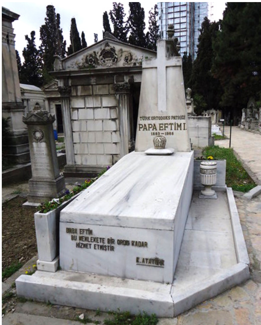
Ο τάφος του με τα λόγια του Κεμάλ

Το 1962 υπέστη εγκεφαλικό επεισόδιο. Λόγω της κατάστασης της υγείας του παρέδωσε την διαχείριση των υποθέσεων της «Εκκλησίας» του στον γιο του Τουργκούτ (πρώην Γεώργιο) Ερενερόλ, που επαγγελοταν τον γιατρό και τον αντικατέστησε. Στον τάφο του έχει χαραχθεί μια δήλωση που είχε κάνει γι' αυτόν ο Κεμάλ το 1923: «Ο Παπαευτίμ' άξιζε όσο μια στρατιωτική μεραρχία...».