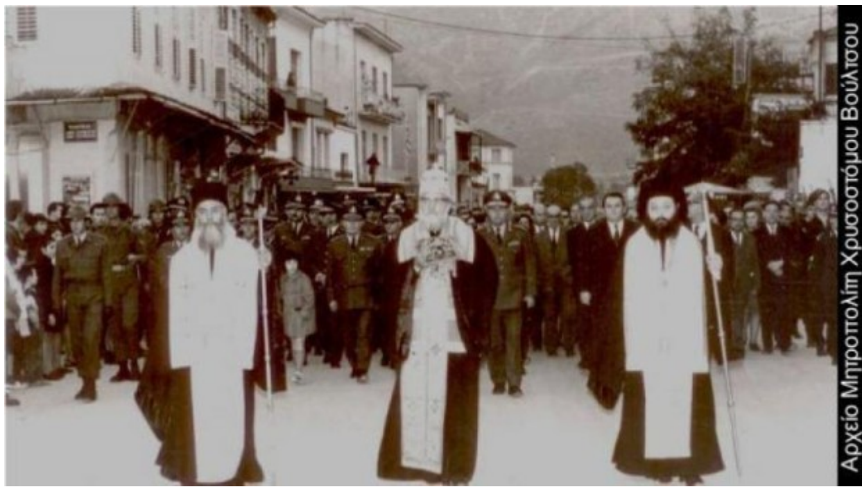
Αρχείο Μητροπολιτη Χρυσοστόμου Βούλτσου