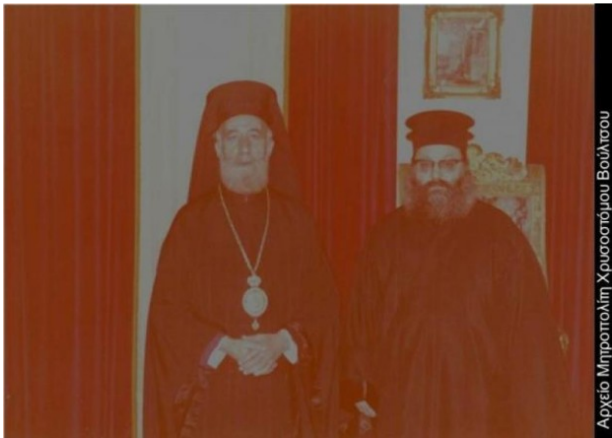
Αρχείο Μητροπολιτή Χρυσοστόμου Βούλτσου