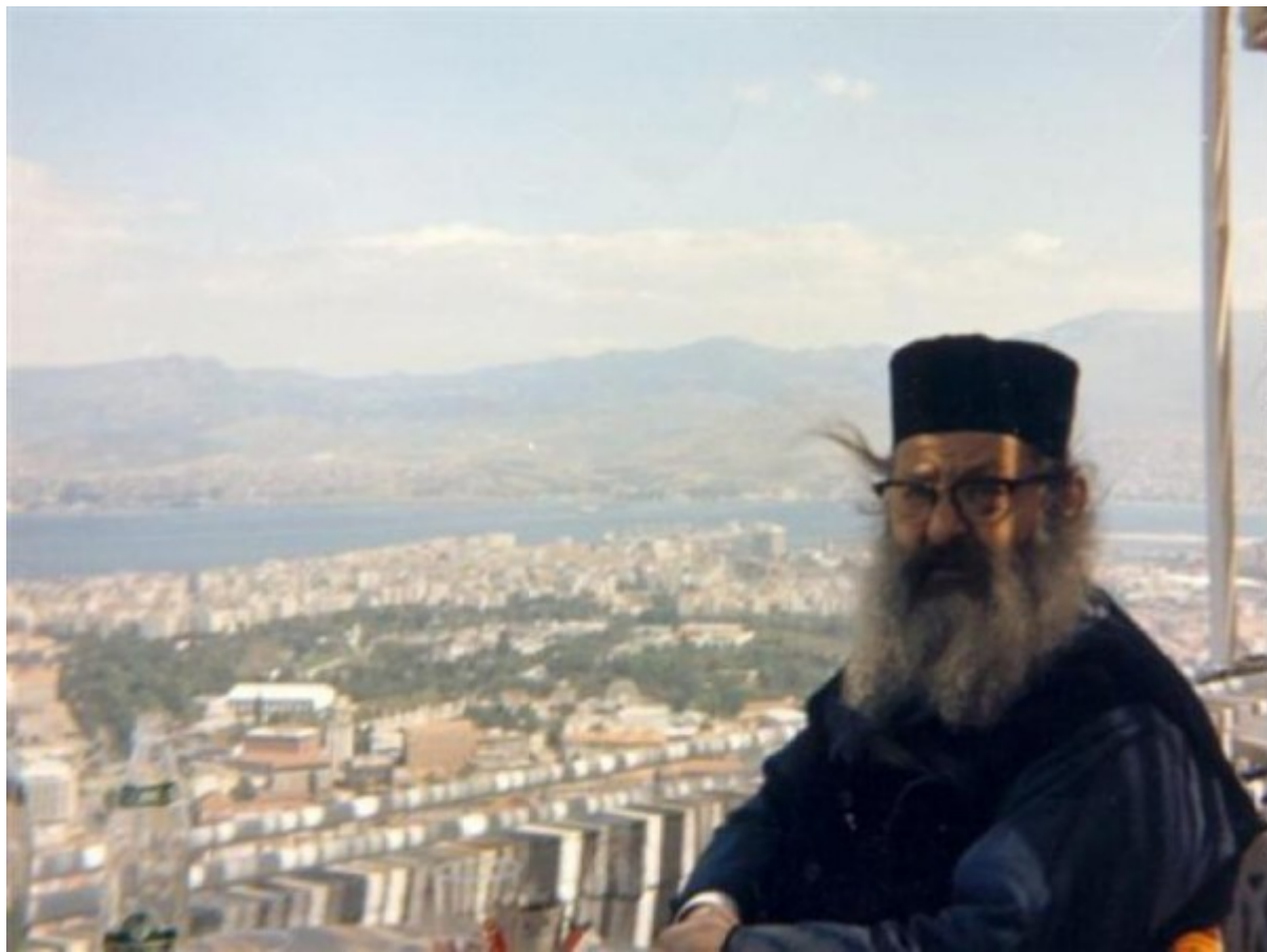
Αρχείο Μητροπολιτη Χρυσοστόμου Βούλγατου