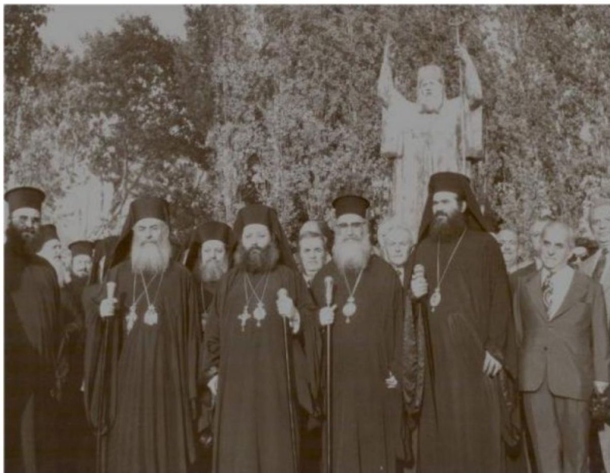
Αρχείο Μητροπολιτη Χρυσοστόμου Βούλγατου