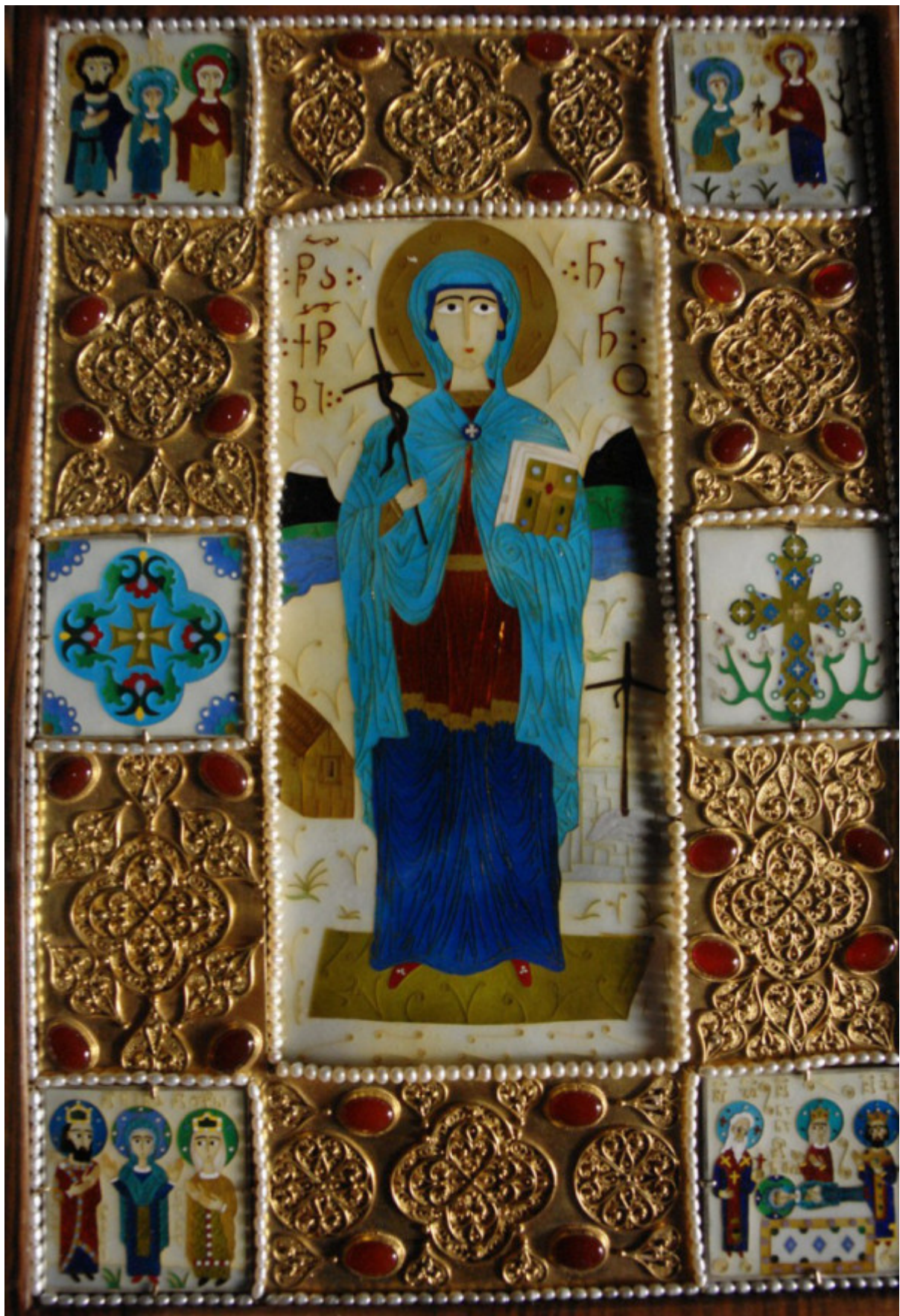
Παραδοσιακή γεωργιανική εικόνα της αγίας Νίνας από σμάλτο και πολύτιμους λίθους.