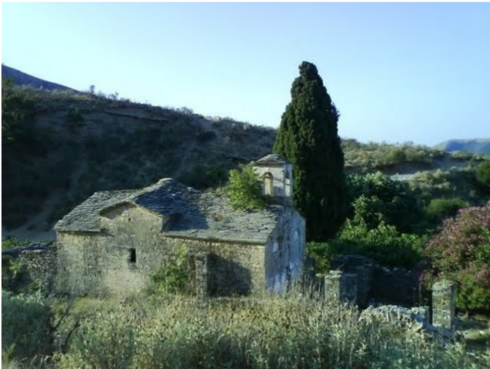
7. Μονή Κοιμήσεως της Θεοτόκου Κοκαμιάς.