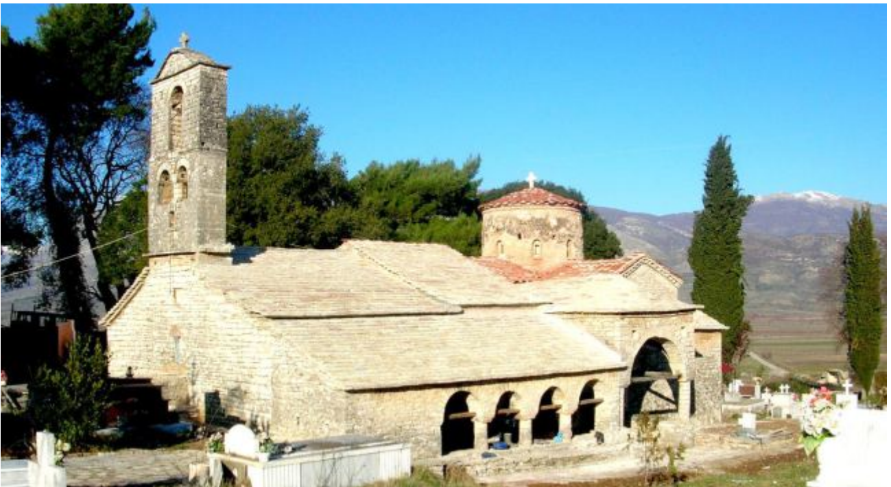
10. Εκκλησία της Παναγίας στο νησί Μάλιγκραντ. της Μικρής Πρέσπας