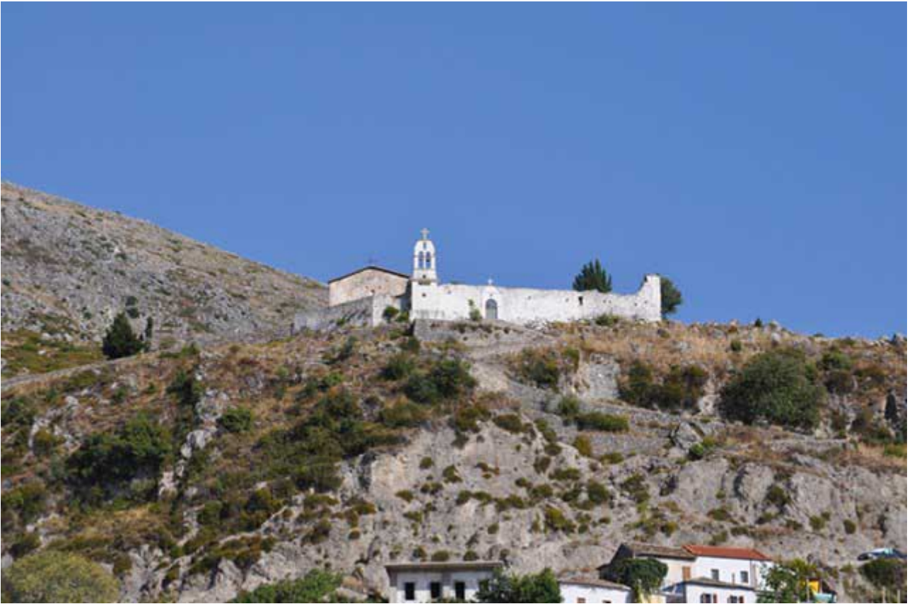
9. Μονή Κοιμήσεως της Θεοτόκου Δρυανού