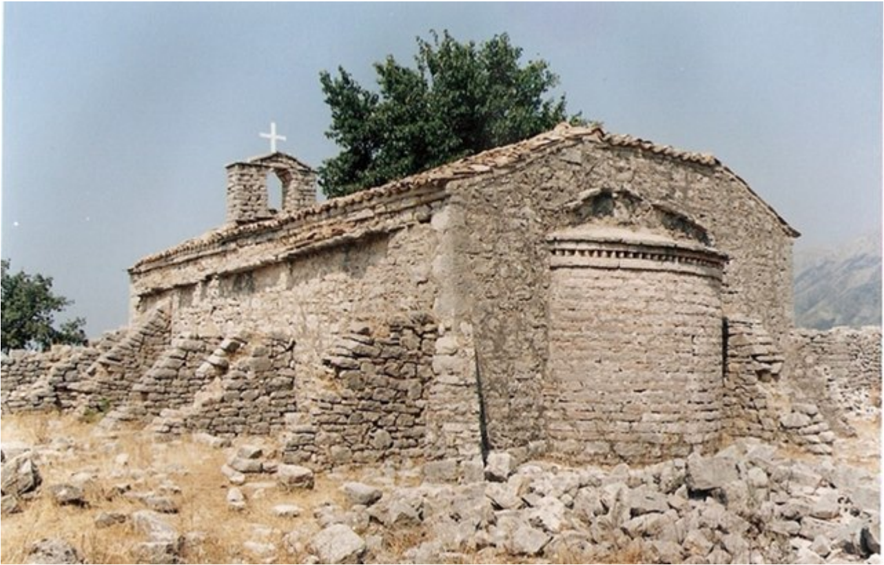
6. Μονή Κοιμήσεως της Θεοτόκου Καμένης.