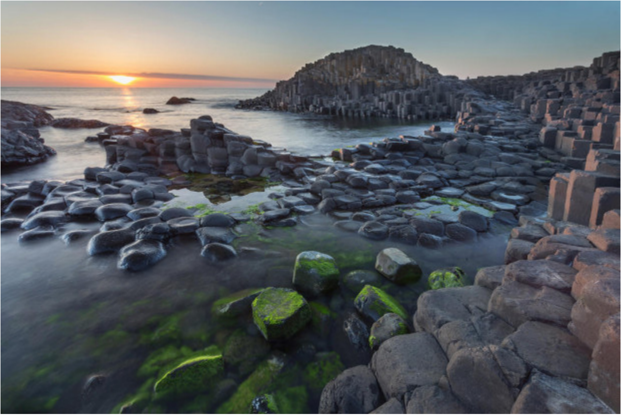
Giant's Causeway, Ηνωμένο Βασίλειο