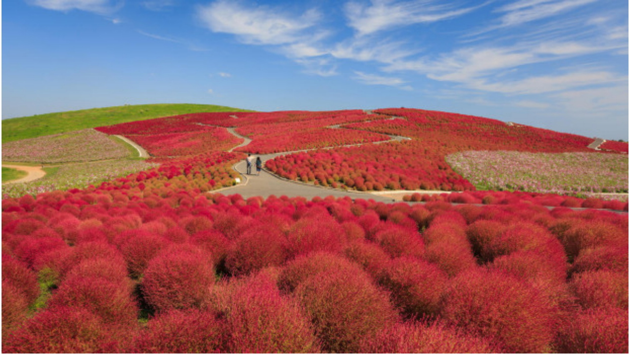
Hitachi Seaside Park, Ιαπωνία

«Πολύ καλό για να είναι αληθινό» θα έλεγαν όσοι έβλεπαν αυτά τα πανέμορφα και «παράξενα» τοπία.