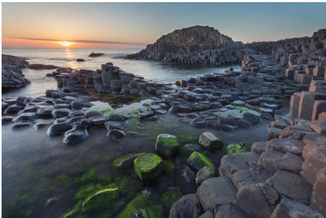
Giant's Causeway, Ηνωμένο Βασίλειο