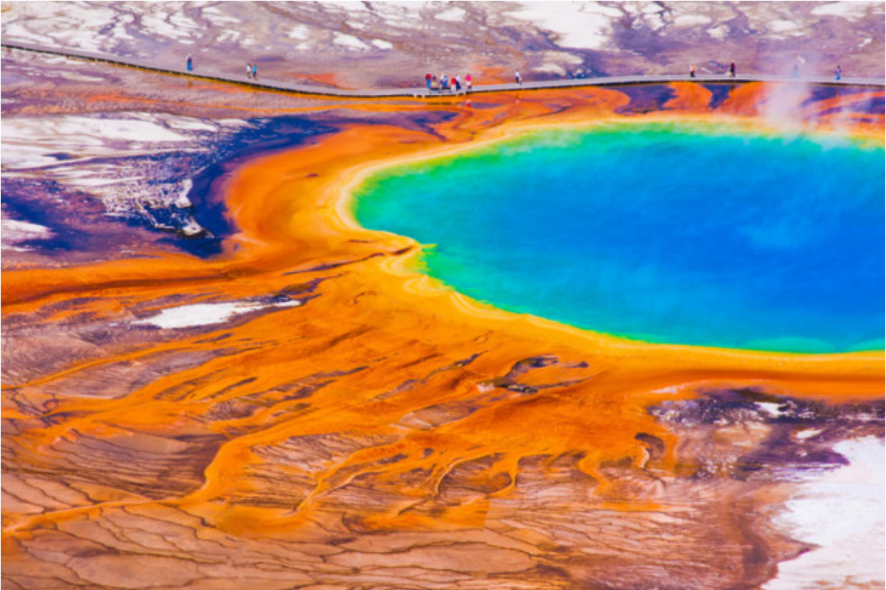
Yellowstone National Park, ΗΠΑ