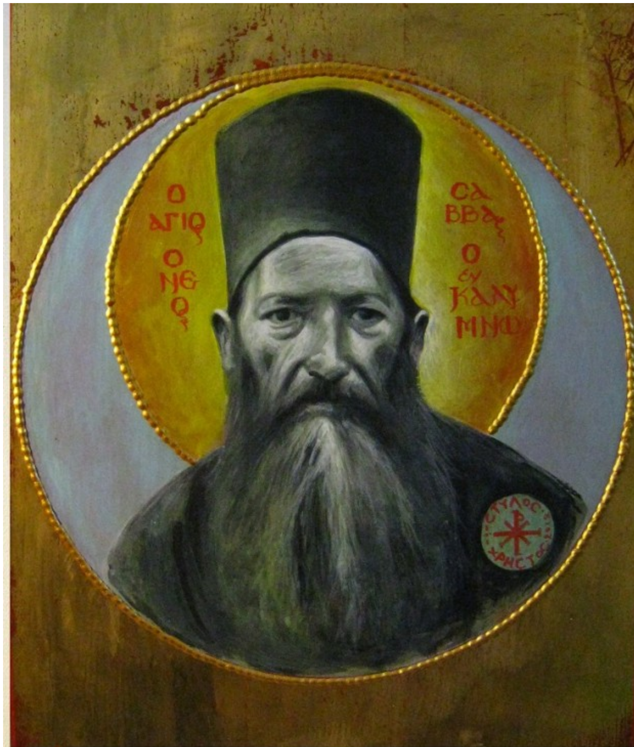
Όσιος Σάββας ο Νέος ο εν Καλύμνω - Χρήστος Στύλος©

πατρός Σάββα δια Πατριαρχικής Συνοδικής Πράξεως της 19ης Φεβ 1992 . Το 2001 το θαυματουργό Λείψανο του Αγίου μεταφέρθηκε στον νέο μεγαλόπρεπο ιερό ναό που οικοδομήθηκε , με τη βοήθεια του Καλυμνιακού λαού και όλων εκείνων οι οποίοι ευεργετήθηκαν από τον Άγιο μέσα από το πλήθος των θαυμάτων τα οποία συνεχώς αναφέρονται στη Μονή .