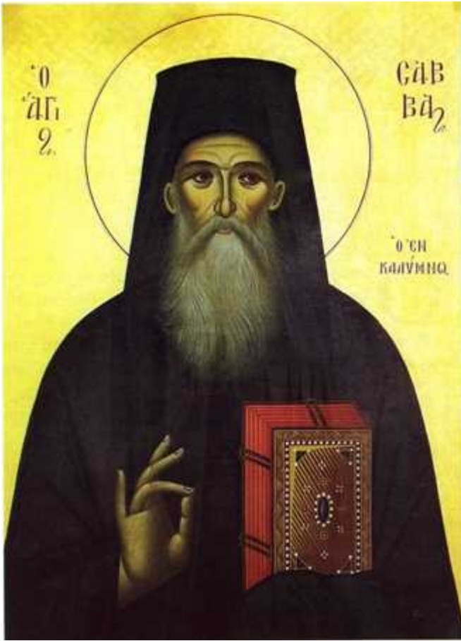
Όσιος Σάββας ο Νέος ο εν Καλύμνω