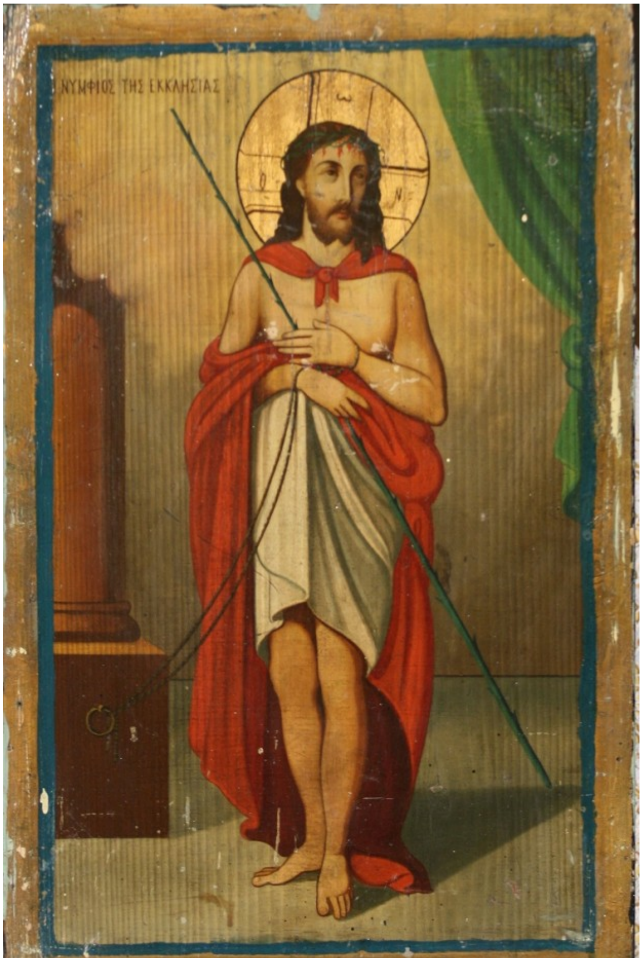
Ιδού, ο Νυμφίος έρχεται.... - Ι.Ν. Ζωοδόχου Πηγής, Λαρίσης ( http://www.panagialarisis.gr )