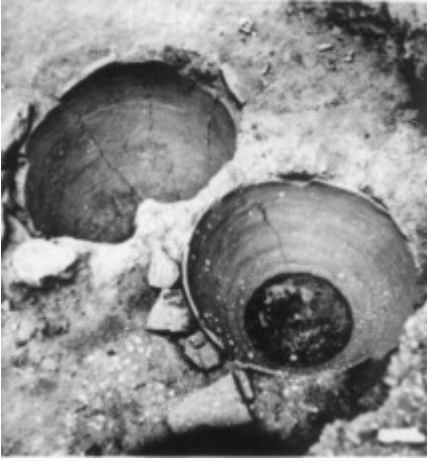
Το πιθάρι με τα λείψανα της αγίας Ειρήνης ( από εδώ )