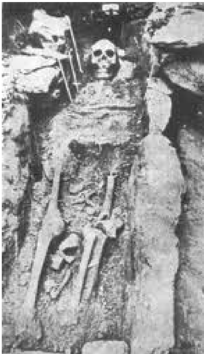
Ο τάφος με τα λείψανα του αγίου Νικολάου, που μαρτύρησε μαζί με τον άγιο Ραφαήλ (αναλυτική εξιστήρηση της ανακάλυψης των αγίων εδώ ).

Μια πηγή που είχε ξεραθεί, ξαφνικά άρχισε να βγάζει νερό, βοηθώντας στις εργασίες ανέγερσης της Εκκλησίας. Κατά τις εργασίες ανέγερσης του μικρού ξωκκλησιού, ανευρίσκεται στα θεμέλια ένας τάφος με λείψανα ενός χριστιανού του οποίου έλειπε η κάτω σιαγόνα. Ένας άγνωστος σ' αυτούς καλόγερος αρχίζει και εμφανίζεται στα όνειρα πολλών ανθρώπων της περιοχής, σε οράματα ή ζωντανά μπροστά τους. Σταδιακά, όλο και περισσότεροι τον βλέπουν, τον ακούν, τον ονειρεύονται. Σε κάποιους λέει το όνομά του, «Ραφαήλ». Σε άλλους λέει, «Είμαι Άγιος και θα κάνω πολλά θαύματα». Σε άλλους, «Είμαι από την Ιθάκη»... Μέρα με τη μέρα ο Άγιος συμπληρώνει την ιστορία του και φανερώνει τα κεκρυμμένα μυστήρια, ενώ στις θαυμαστές αποκαλύψεις εμφανίζονται, και άλλα πρόσωπα μαρτύρων καθώς και ένα ξανθόμαλλο κοριτσάκι. Η Παναγία, αλλά και η Αγία Παρασκευή και άλλοι Άγιοι παρουσιάζονται συχνά και αυτοί σε ενύπνια ή οράματα