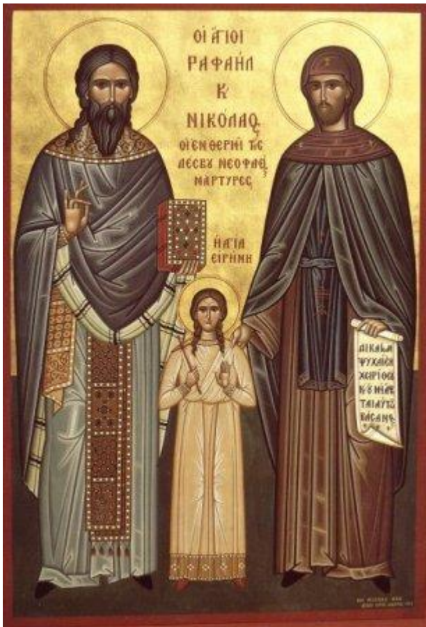
Ἅγιοι Ραφαήλ, Νικόλαος, Ειρήνη και οι συν αυτοίς

Επίσημος κατάταξη του Αγ. Ραφαήλ και των συν αυτώ, εις το Αγιολόγιον της Εκκλησίας