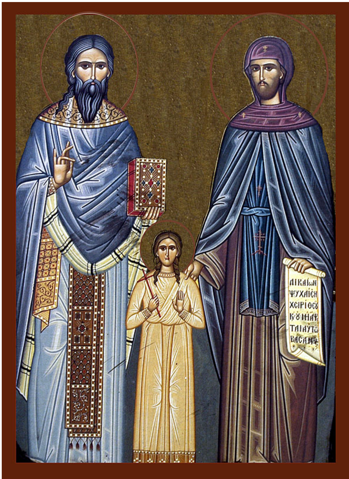
Άγιοι Ραφαήλ, Νικόλαος, Ειρήνη και οι συν αυτοίς