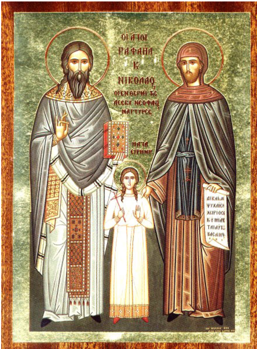
Άγιοι Ραφαήλ, Νικόλαος, Ειρήνη και οι συν αυτοίς