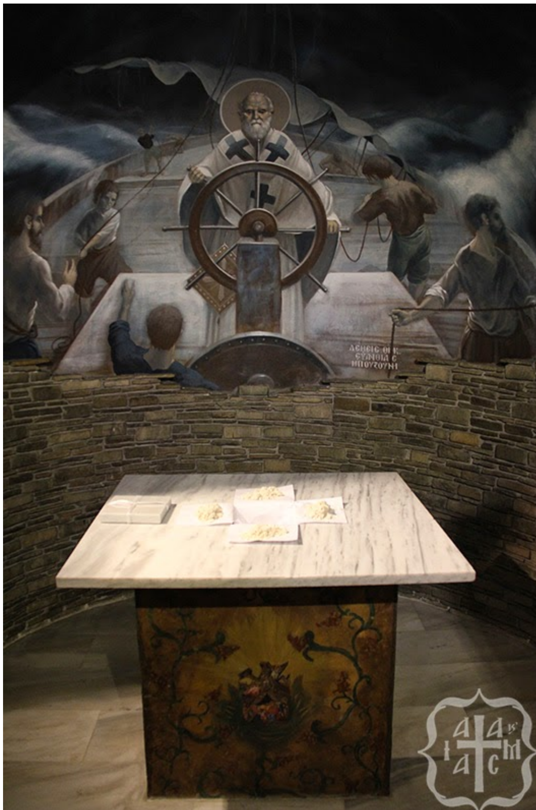
Γραφείο Τύπου Ιεράς Μητροπόλεως Φωκίδος Πηγή: freemonks.gr