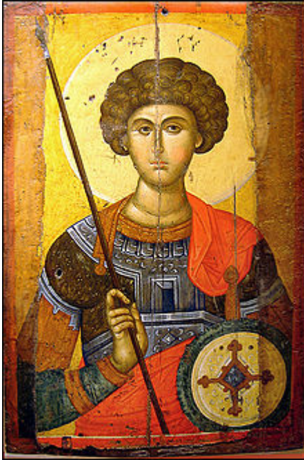
Ο Άγιος Μεγαλομάρτυρας και Τροπαιοφόρος

Γεώργιος έζησε στα χρόνια του αυτοκράτορα Διοκλητιανού, στα τέλη του 3ου αιώνα. Ήταν ένας νέος είκοσι ετών από επιφανή και πλούσια οικογένεια της Καππαδοκίας, με βαθιά πίστη στο Χριστό και με πολλά προσόντα, θα λέγαμε σήμερα, αφού είχε ήδη καταφέρει τόσο νέος να πάρει το αξίωμα του Κόμη, του Στρατηλάτη.