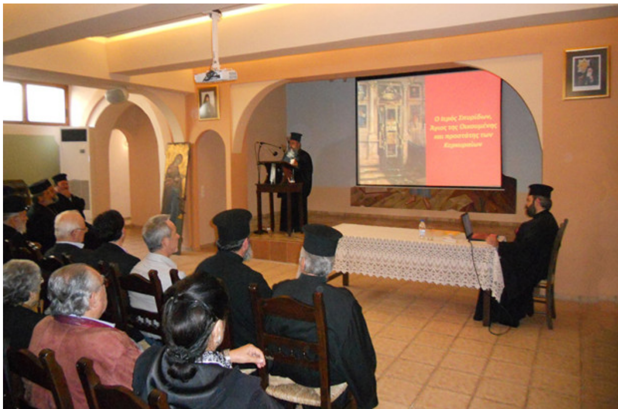
Από την Ιερά Μητρόπολη Ρεθύμνης και Αυλοποτάμου