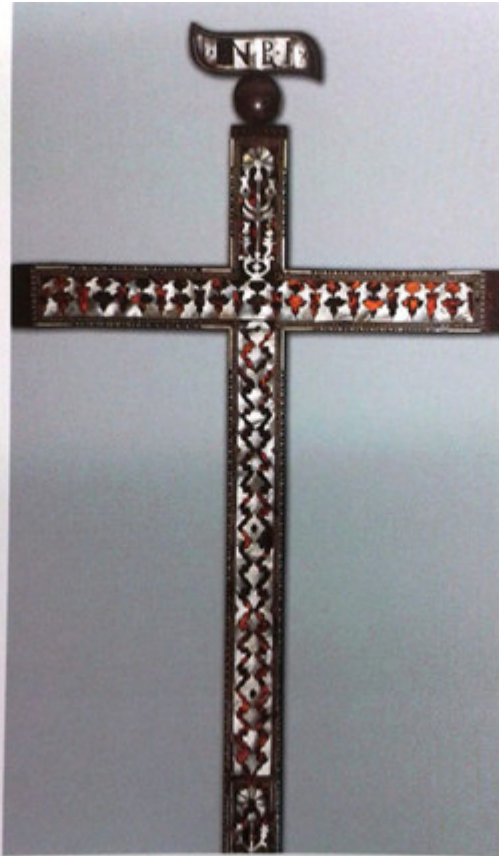
Ὁ Σταυρός τῶν Κρητῶν, φτιαγμένος ἀπὸ μάργαρο καὶ ἐλεφαντόδοντο, δωρεὰ τῶν Γάλλων Δημοκρατικῶν.