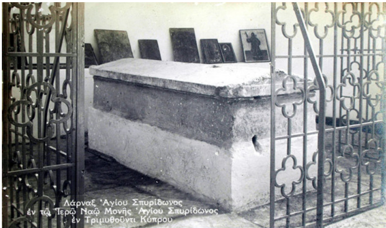
Λάρναξ Ἁγίου Σπυρίδωνος ἐν τῷ Τερῶ Ναῶ Μονῆς Ἁγίου Σπυρίδωνος ἐν Τριμυθοῦντι Κύπρου

Ο ΤΑΦΟΣ ΤΟΥ ΑΓΙΟΥ ΣΤΗΝ ΤΡΙΜΥΘΟΥΝΤΑ ΤΗΣ ΚΥΠΡΟΥ( φωτ. Της δεκαετίας του 1930)