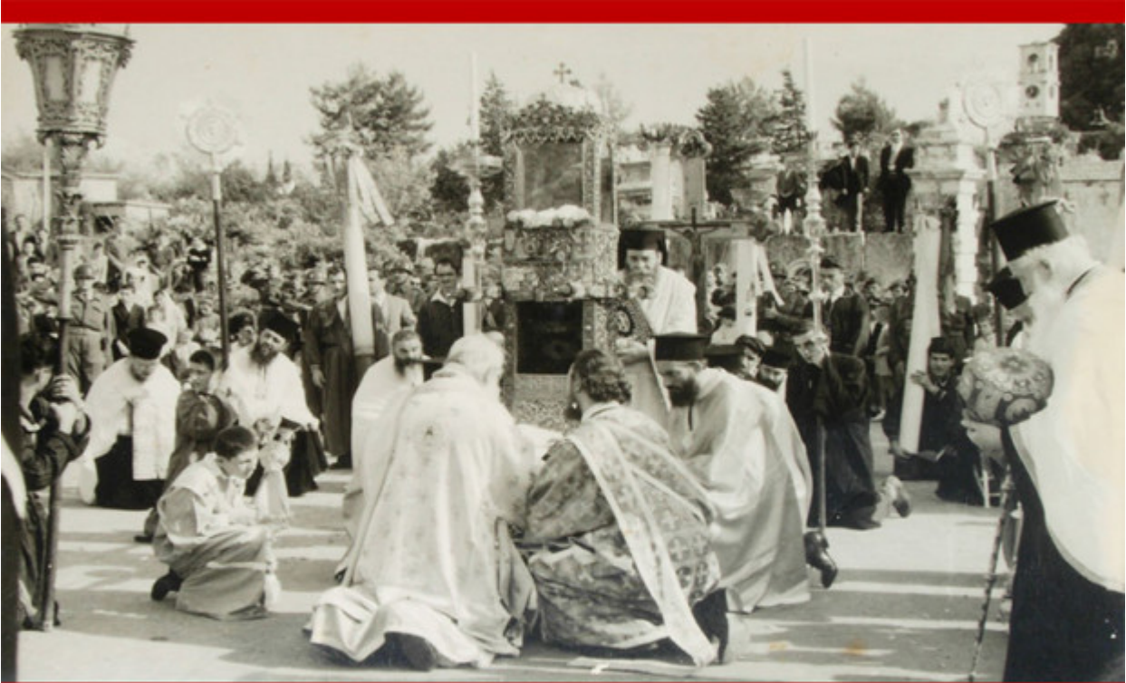
Δέηση μπροστά στο Παλαιό Φρούριο. Γονυπετής ο Μητροπολίτης Κερκύρας και Παξών Μεθόδιος, μέσα 20 ου αι.