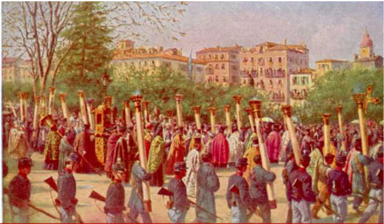
Λιτανεία Αγίου Σπυρίδωνος. Μ. Σάββατο, 1912. Έργον, Γεωργίου Σαμαρτζή