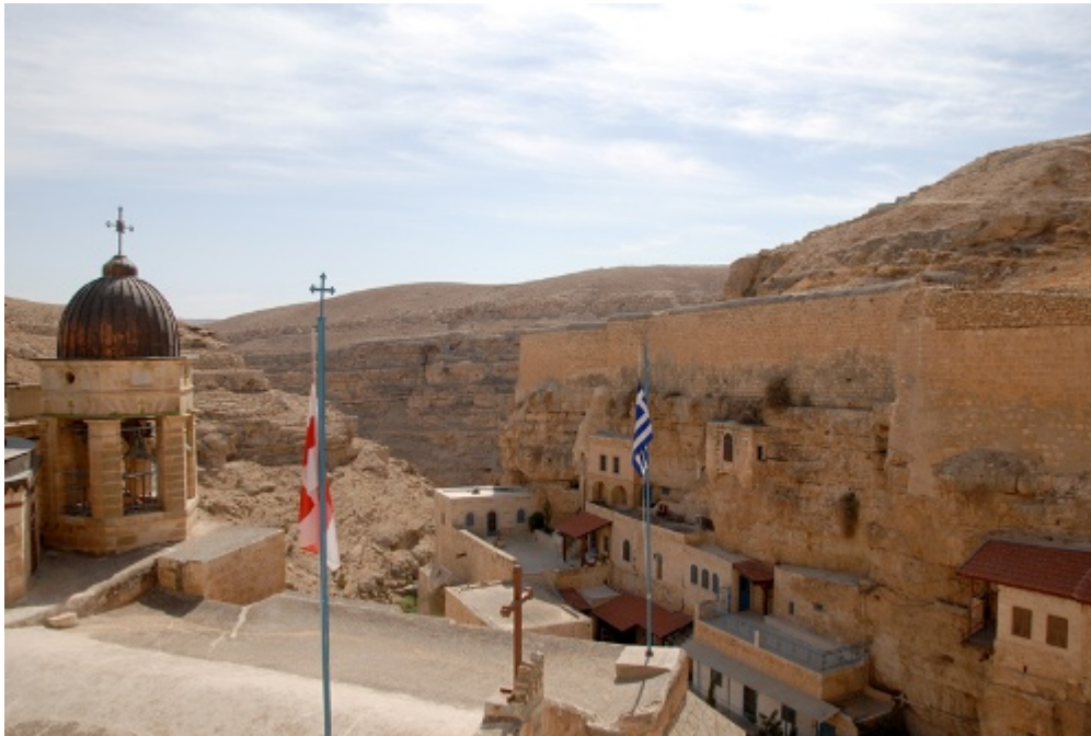
Η Ιερά Λαύρα του Οσίου Σάββα του Ηγιασμένου

Επίσημη Εορταστική Εκδήλωση με θέμα « Άγγελοι τῆς Ἐρήμου », διοργανώνεται από την Ιερά Λαύρα του Οσίου Πατρός ημών Σάββα του Ηγιασμένου στο Μέγαρο Μουσικής Αθηνών στις 3 Μαΐου 2015 και ώρα 7 μ.μ.