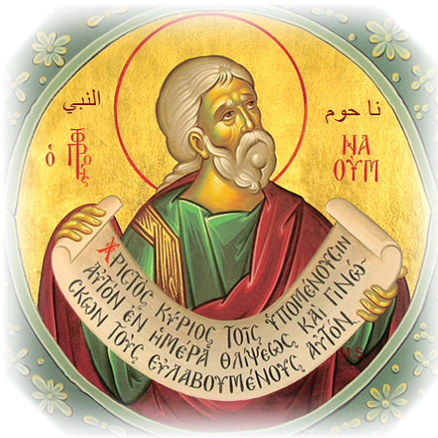
A família de Naum era

originária de uma aldeia que mais tarde recebeu o nome do profeta, em sua homenagem. No Evangelho, Cafarnaum é mencionada para designar a aldeia de Naum, na parte norte do Lago da Galiléia. Depois da destruição do reino de Israel pelos assírios (722 a C) os descendentes de Naum se mudaram para Judá, onde iniciou seu serviço profético, no início do século VII a. C. No terceiro capítulo de seu Livro, Naum fala principalmente do castigo de Nínive, a capital da Assíria. No passado, Nínive sentiu o peso da mão de Deus, pelo castigo, para que o povo hebreu voltasse a razão. Por isso Isaias chamava a Assíria: “Ai da Assíria, a vara da minha ira, porque a minha indignação é como bordão nas suas mãos. (Is 10-5,15) Naum descreve em imagens muito reais o castigo dos hebreu pelos assírios: “O Senhor é tardio em irar-se, mas grande em poder, e ao culpado não tem por inocente; o Senhor tem o seu caminho na tormenta e na tempestade, e as nuvens são o pó dos seus pés. Ele repreende ao mar, e o faz secar, e esgota todos os rios; desfalecem Basã e o Carmelo, e a flor do Líbano murcha. Os montes tremem perante ele, e os outeiros se derretem; e a terra se levanta na sua presença; e o mundo, e todos os que nele habitam. Quem parará diante do seu furor, e quem