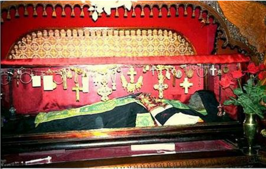
رفات القديس سابا