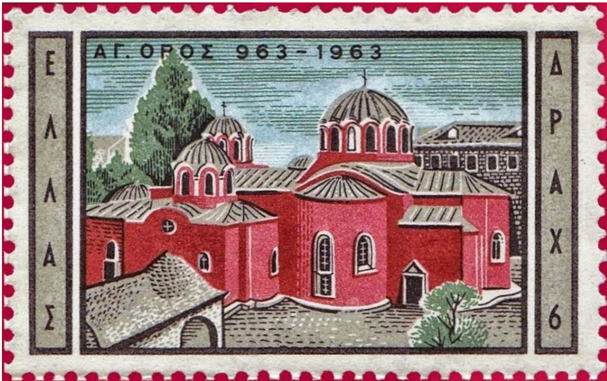
1963 Άγιο Όρος. Το Καθολικό της Μεγίστης Λαύρας

Κατά καιρούς τα Ελληνικά Ταχυδρομεία εξέδωσαν γραμματόσημα με θέματα που αφορούσαν το Άγιον Όρος. Στην παρούσα ανάρτηση δημοσιεύω τα γραμματόσημα που απεικονίζουν παραστάσεις σχετικές με την ΙΕΡΑ ΜΟΝΗ ΜΕΓΙΣΤΗΣ ΛΑΥΡΑΣ .