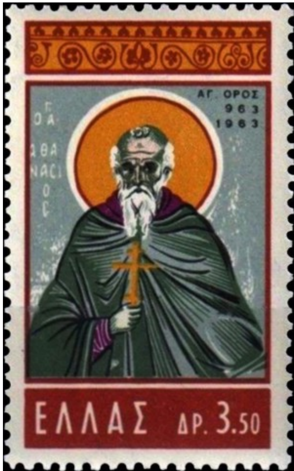
1963 Άγιος Αθανάσιος ο Αθωνίτης