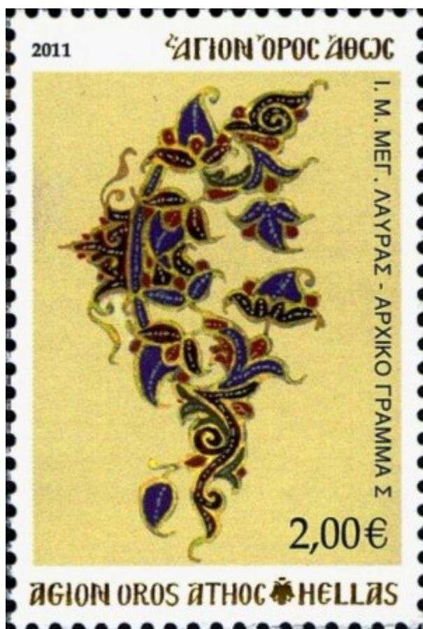
2011 Ιερά Μονή Μεγίστης Λαύρας Πρωτόγραμμα. Το γράμμα Σ