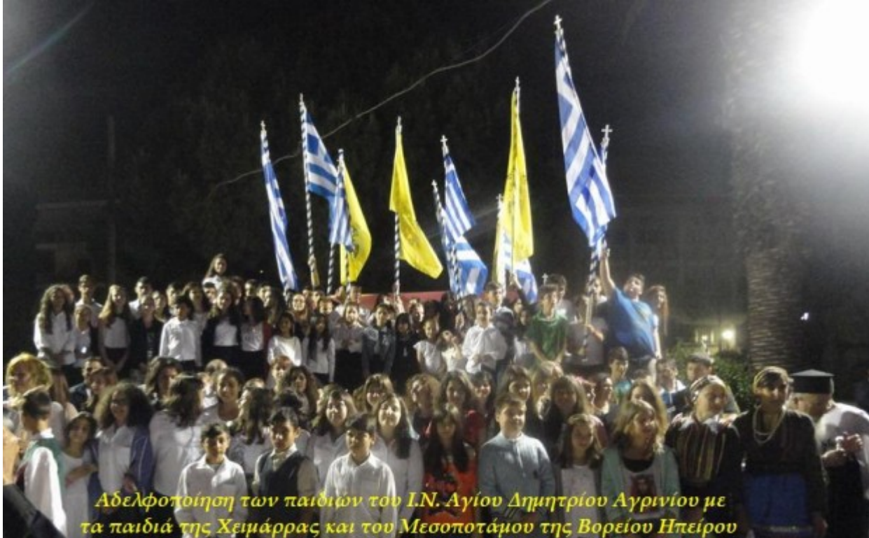
Αδελφοποίηση των παιδιών του Ι.Ν. Αγίου Δημητρίου Αργινίου με τα παιδιά της Χειμάρρας και του Μεσσοποτάμου της Βορείου Ηπείρου

Εκδήλωση της 6ης «Χριστιανικής Αγάπης» κδήλωση της 6ης «Χριστιανικής Αγάπης» που διοργάνωσε ο Ιερός Ναός Αγίου Δημητρίου Αργινίου σε συνεργασία με το Κέντρο Ενότητας και Μελέτης - Προβολής των Ελληνικών Αξιών «Ενωμένη Ρωμηοσύνη»