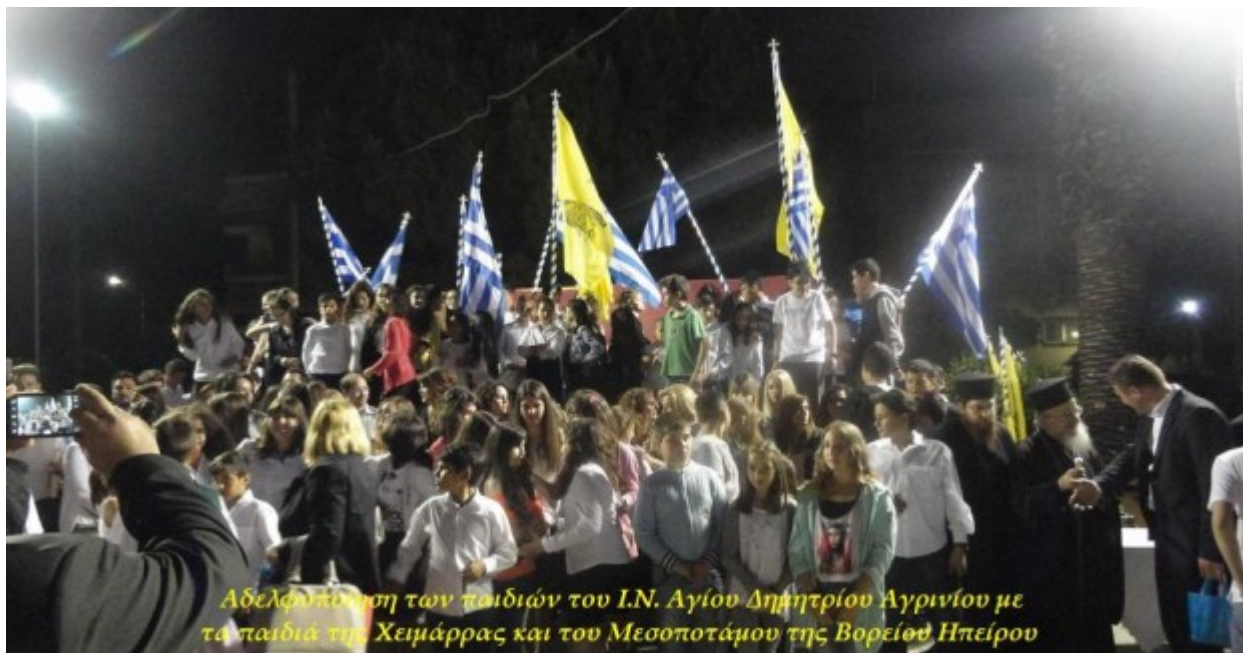
Αδελφότητα των παιδιών του Ι.Ν. Αγίου Δημητρίου Αργινίου με τα παιδιά της Χειμάρρας και του Μεσσοποτάμου της Βορείου Ηπείρου