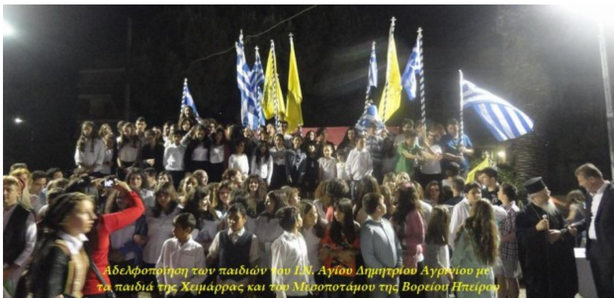
Αδελφοποίηση των παιδιών του Ι.Ν. Αγίου Δημητρίου Αργινίου με τα παιδιά της Χειμάρρας και του Μεσσοποτάμου της Βορείου Ηπείρου