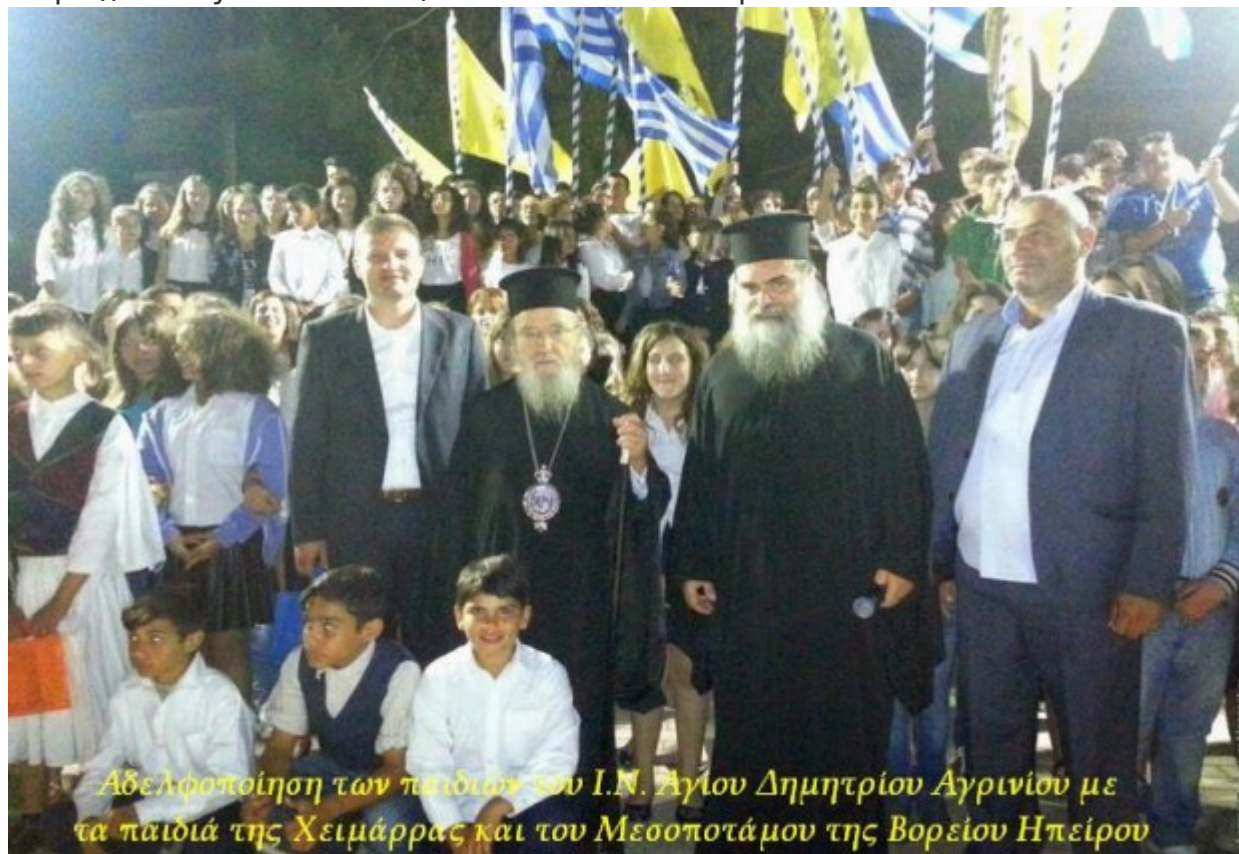
Αδελφοποίηση των παιδιών του Ι.Ν. Αγίου Δημητρίου Αγρινίου με τα παιδιά της Χειμάρρας και του Μεσοποτάμου της Βορείου Ηπείρου

https://www.youtube.com/watch?v=Y4Ei0UrepCY