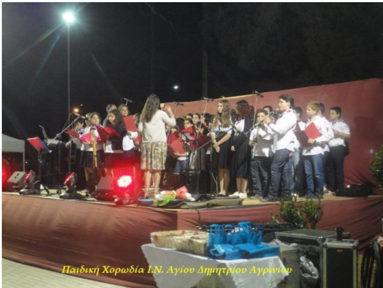
Παιδική Χορωδία Ι.Ν. Αγίου Δημητρίου Αργινίου