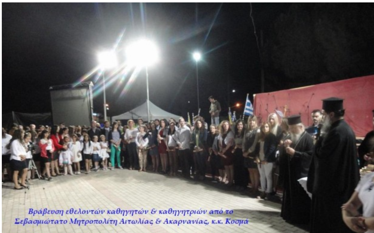
Βράβευση εθελοντών καθηγητών & καθηγητριών από το Σεβασμιώτατο Μητροπολίτη Αιτωλίας & Ακαρνανίας, κ.κ. Κοσμά