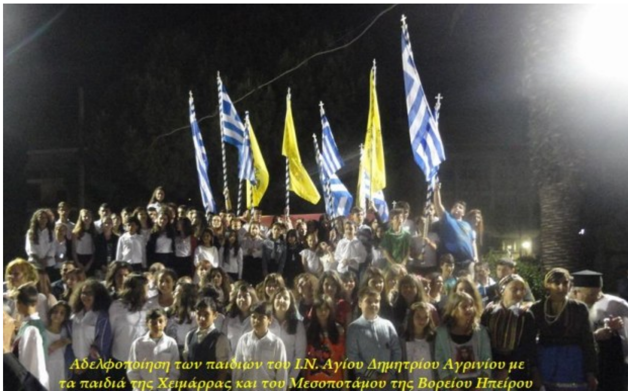
Αδελφοποίηση των παιδιών του Ι.Ν. Αγίου Δημητρίου Αργινίου με τα παιδιά της Χειμάρρας και του Μεσσοποτάμου της Βορείου Ηπείρου