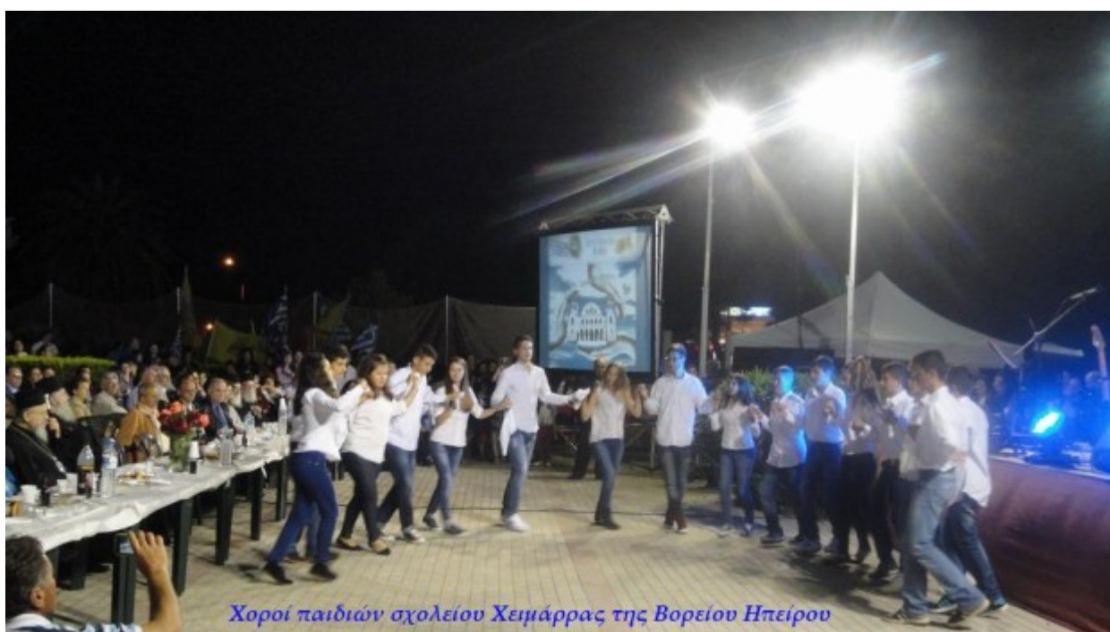
Χοροί παιδιών σχολείου Χειμάρρας της Βορείου Ηπείρου