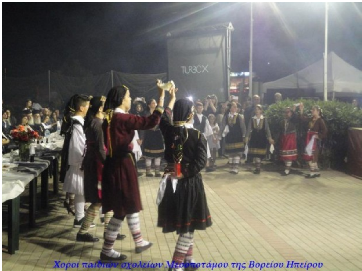
Χοροί παιδιών σχολείων Μεσσηνιακού της Βορείου Ηπείρου