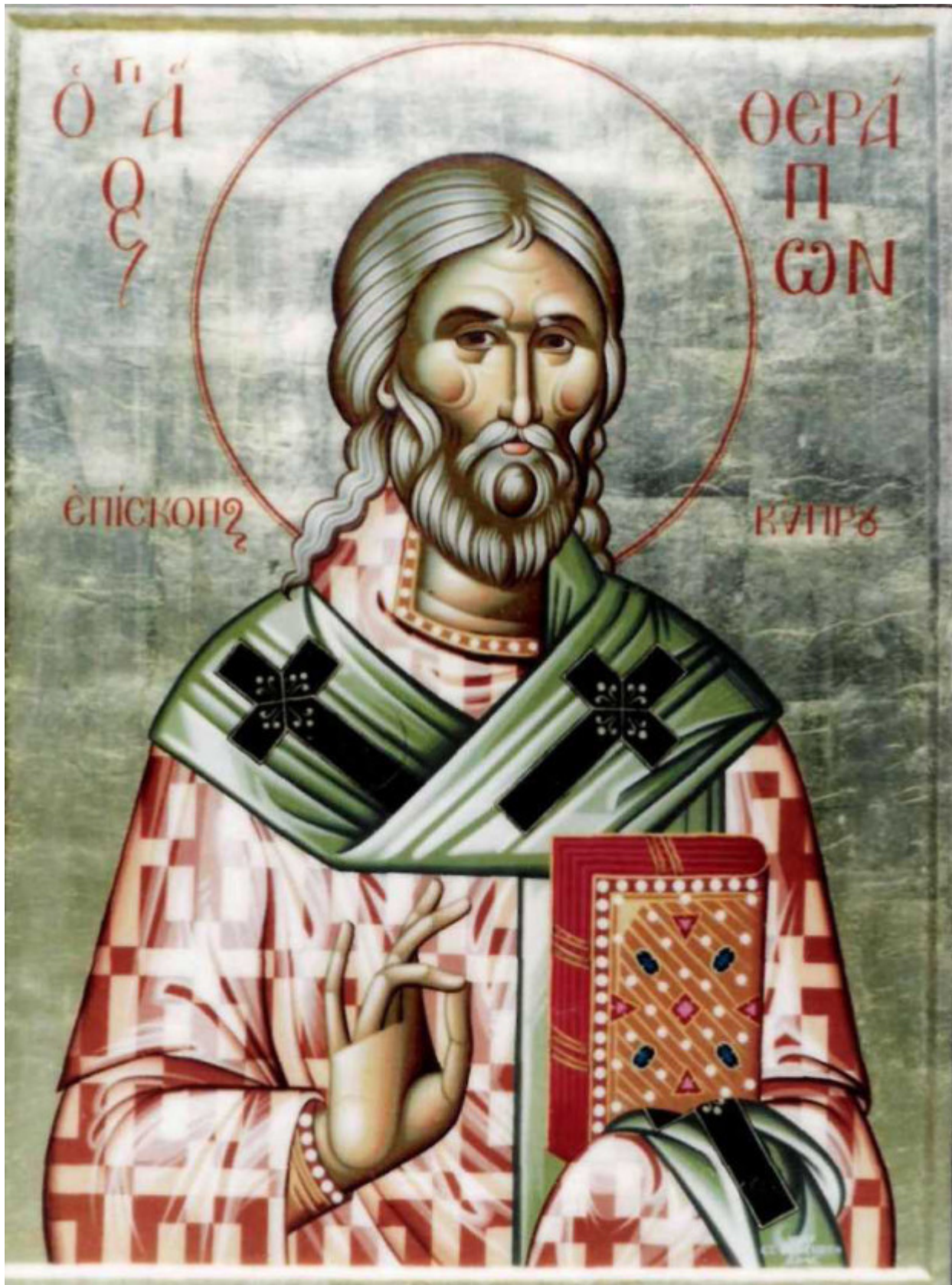
Άγιος Θεράπων επίσκοπος Κύπρου