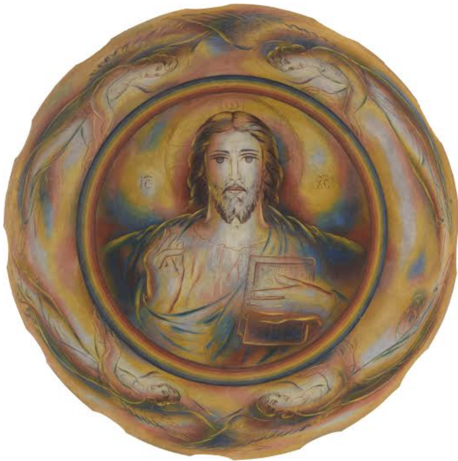
Γιώργος Γουναρόπουλος, Ο Παντοκράτορας στον τρούλο του Ι.Ν. Αγίας Τριάδας Βόλου