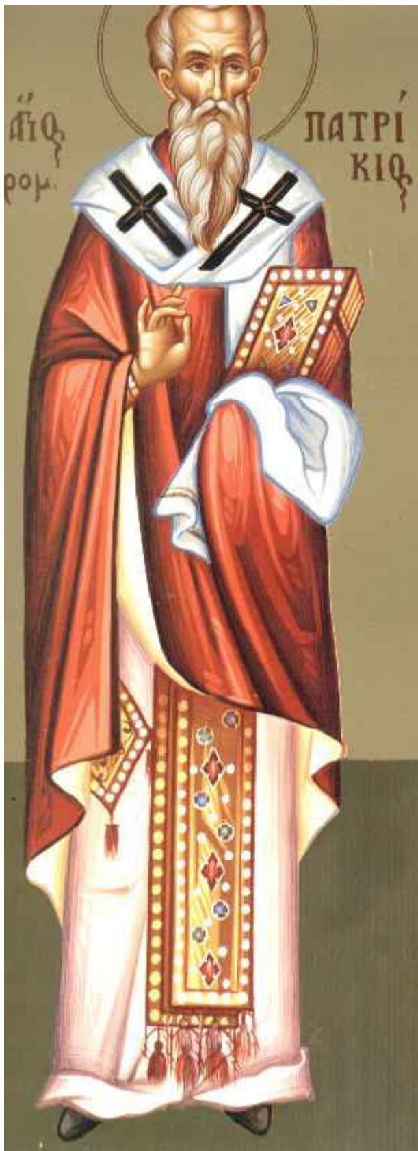
Άγιος Πατρίκιος επίσκοπος Προύσας