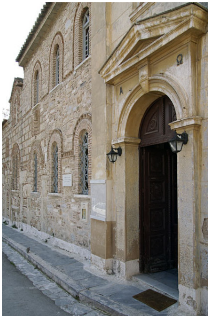
Αγιος Νικόλαος Ραγκαβά

Η διαδικασία είναι απλή και έχει ως εξής: καλείστε να πάρετε το χάρτη από το σημείο εκκίνησης, δηλαδή τον Ναό του Αγίου Ελευθερίου, (παρεκκλήσι της Μητρόπολης, πλ. Μητροπόλεως) και συνεχίζετε με την παρέα σας τη διαδρομή διαμορφώνοντάς την ελεύθερα όπως εσείς θέλετε. Περιηγείστε στους 17 χώρους που θα είναι ανοικτοί, παρακολουθείτε τις ξεναγήσεις, παίρνετε μέρος στα διαδραστικά δρώμενα και στις εκδηλώσεις.