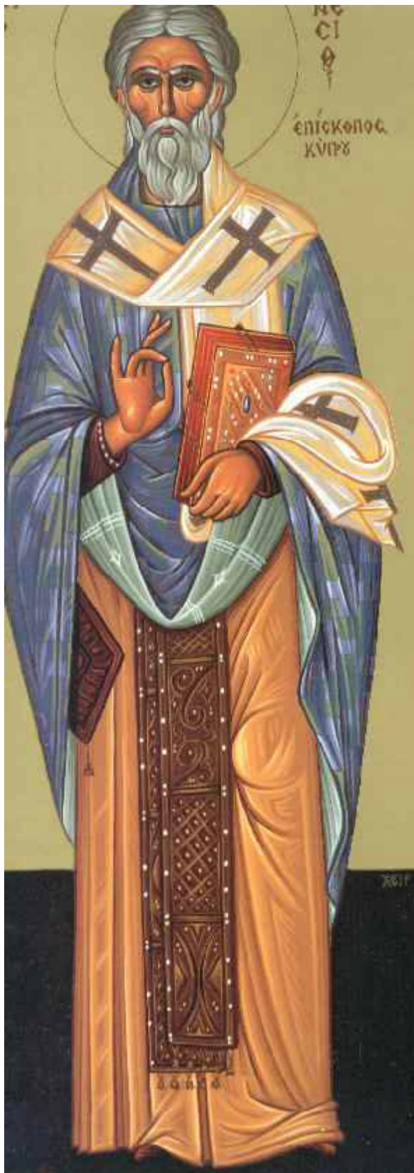
Άγιος Συνέσιος ο Επίσκοπος