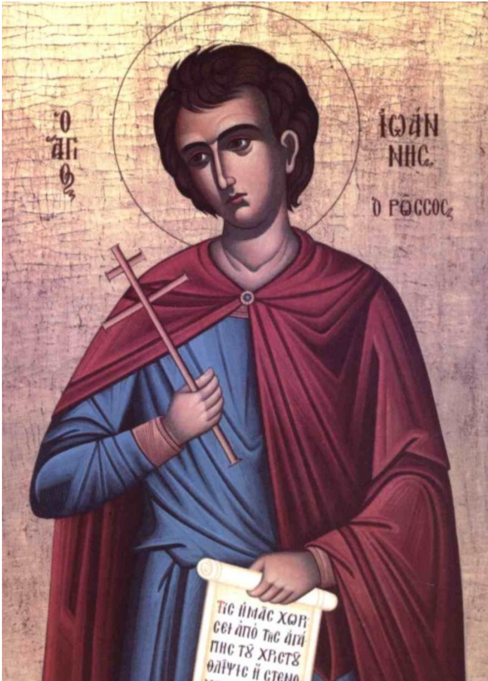
Όσιος Ιωάννης ο Ρώσος