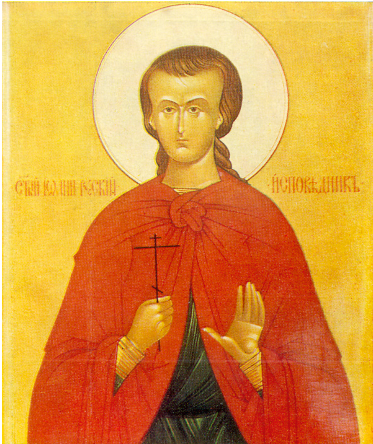
Όσιος Ιωάννης ο Ρώσος