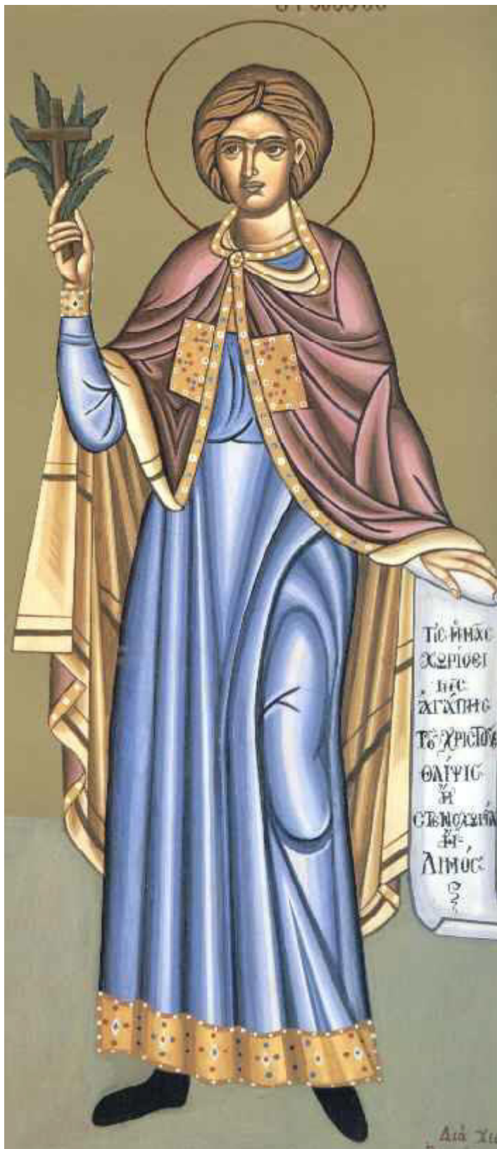
Όσιος Ιωάννης ο Ρώσος