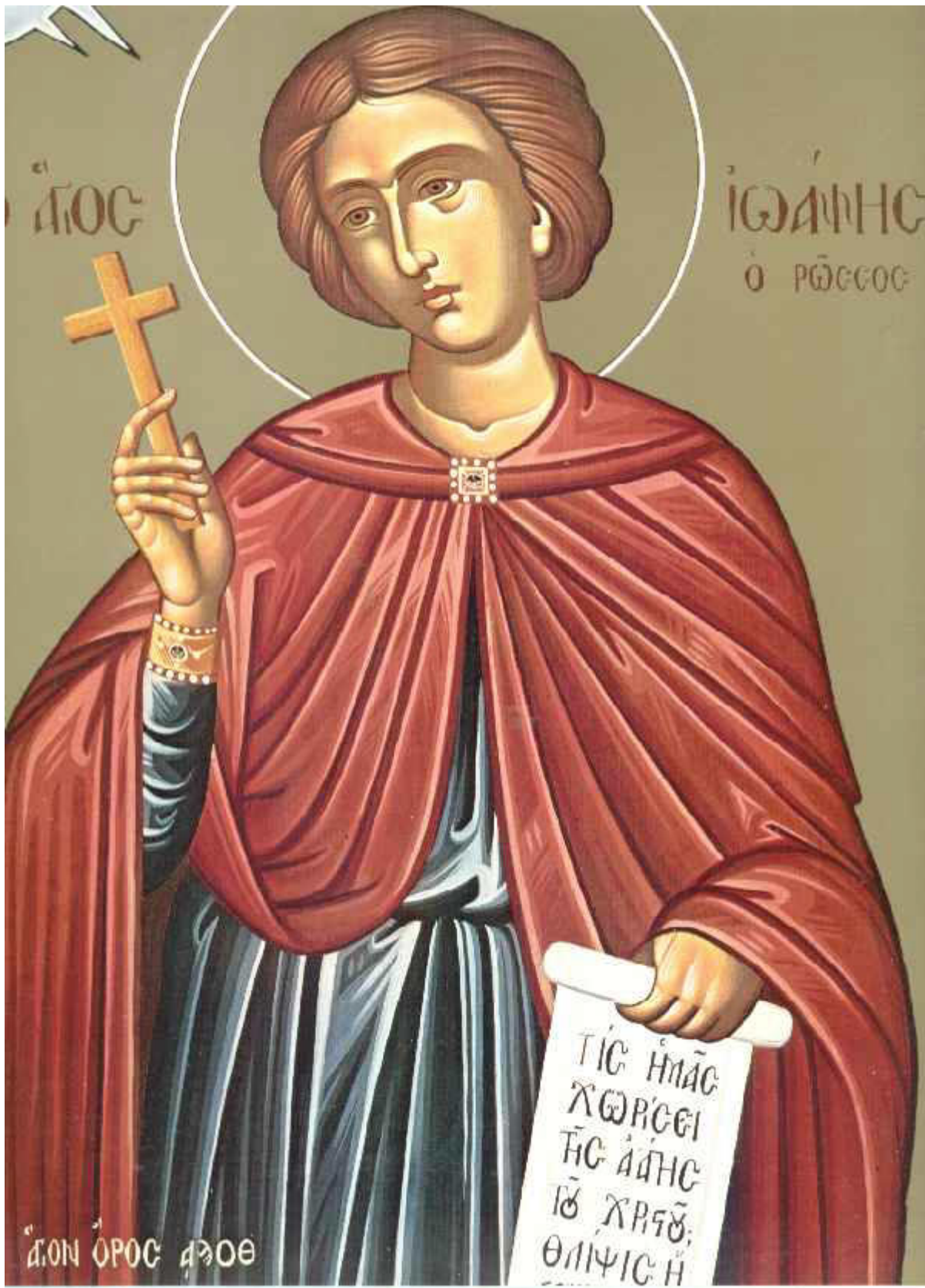
Όσιος Ιωάννης ο Ρώσος