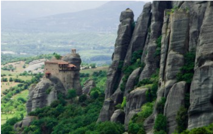
Άγιος Νικόλαος Μετέωρα

Μετέωρα: το δεύτερο πλέον μοναστικό συγκρότημα στην Ελλάδα, ύστερα από το Άγιο Όρος. Από τα τριάντα μοναστήρια που είχε κάποτε, σήμερα λειτουργούν μόνο τα επτά. Επίσης τα μοναστήρια των Μετεώρων συμπεριλαμβάνονται στον κατάλογο μνημείων παγκόσμιας κληρονομιάς της UNESCO.