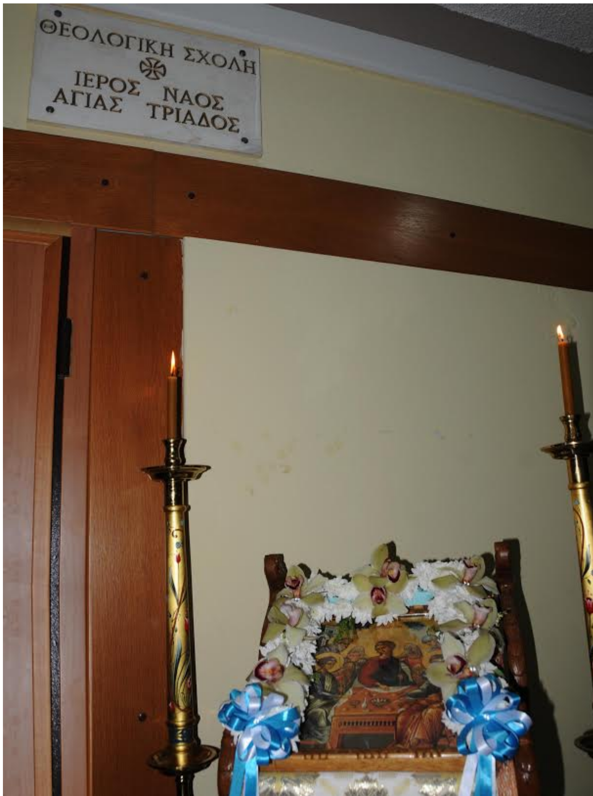
Συντάκτης: Ιστολόγιο «Καταλλαγή» ( http://katallagi.web.auth.gr )