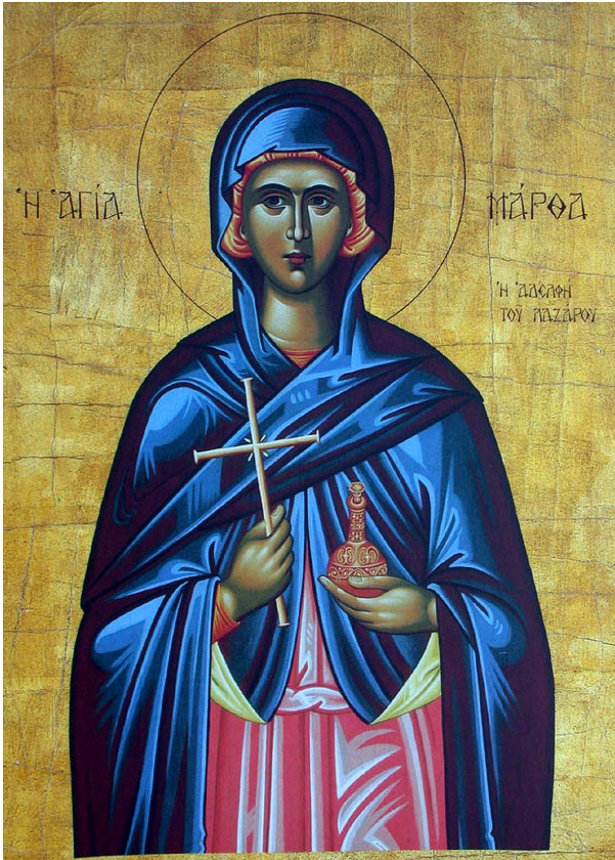
Αγία Μάρθα αδελφή του Λαζάρου