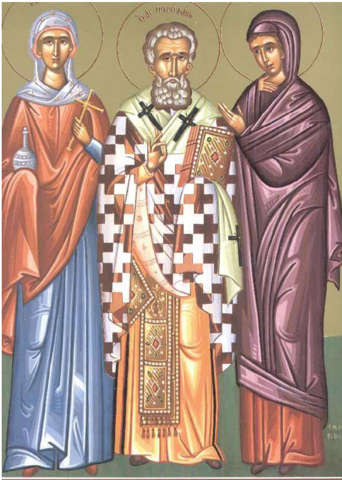
Αγίες Μάρθα και Μαρία οι αδελφές του Λαζάρου

Ἐκ Βηθανίας τὰς ἀδελφὰς Λαζάρου, Σώζειν δύνασθαι καὶ νεκρὰς πιστευτέον. Τετάρτη Μάρθα ἠδὲ Μαρίη ἔβησαν πόλῳ λαμπρῷ.