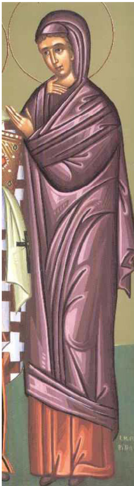
Αγία Μάρθα αδελφή του Λαζάρου