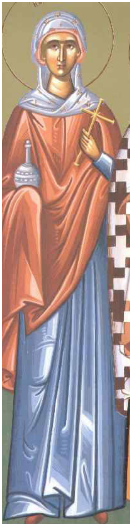
Αγία Μαρία αδελφή του Λαζάρου