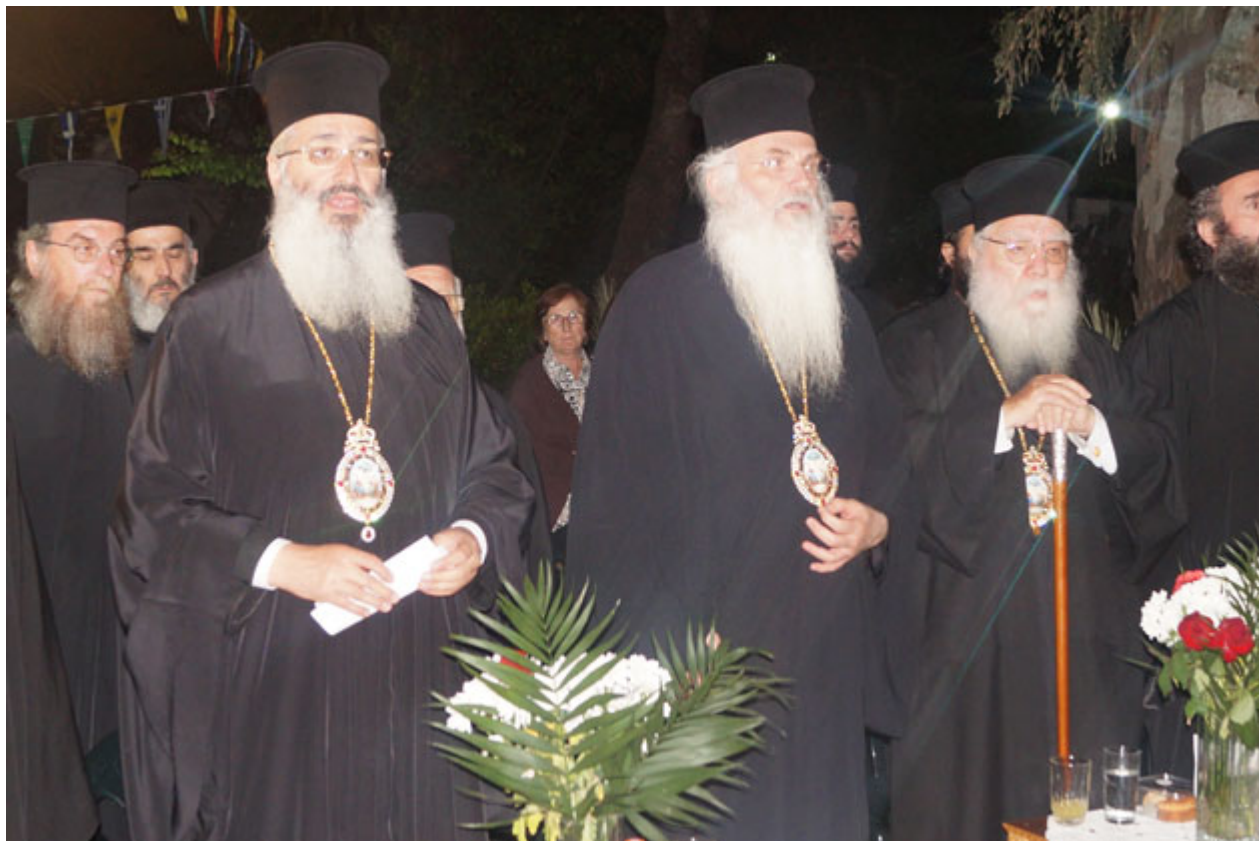
Επιμέλεια - φωτο: Διογένης