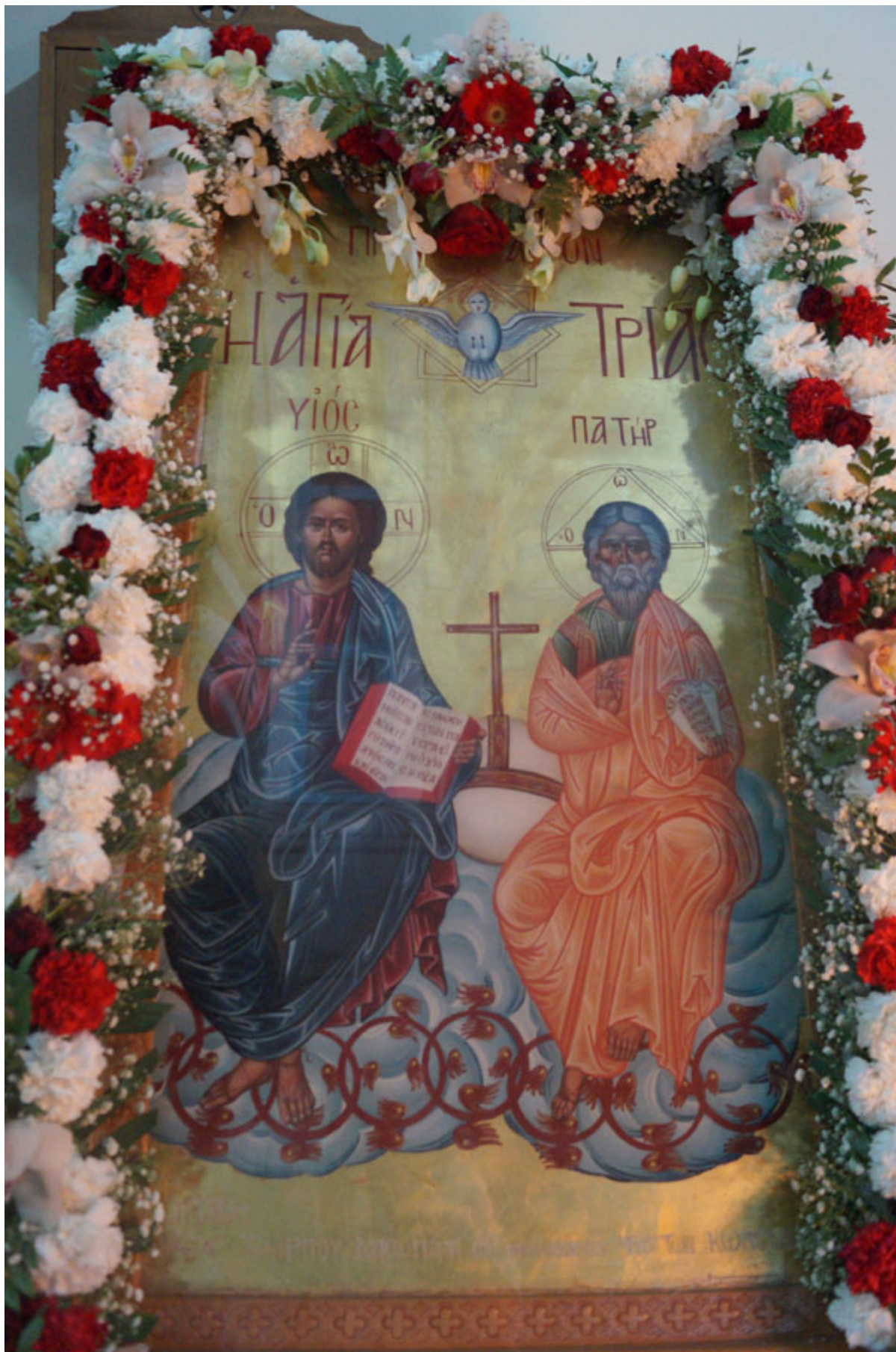
Στο Πανηγυρικό Εσπερινό χοροστάτησε ο Σεβ. Μητροπολίτης Αλεξανδρουπόλεως