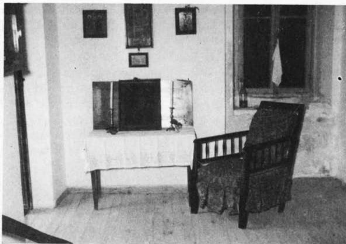
Τὸ δωμάτιο (κελλί) τῆς οἰκίας Γερουλάνου ὅπου ἔμενε ὁ "Άγιος, ὅπως εἶναι σήμερα.