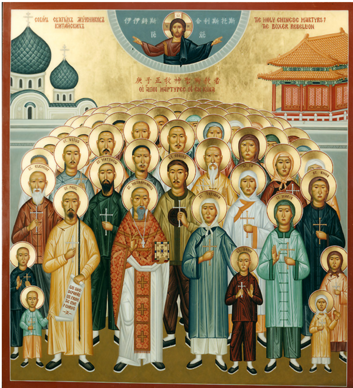
Άγιος Μητροφάνης Τσί-Σούνγκ και οι μαζί μ' αυτόν μαρτυρήσαντες: Τατιανή η Πρεσβυτέρα του, Ησαΐας και Ιωάννης οι γιοι του, Μαρία η νύφη του, Αγία Ία η διδασκάλισσα και άλλοι 222 Κινέζοι Μάρτυρες