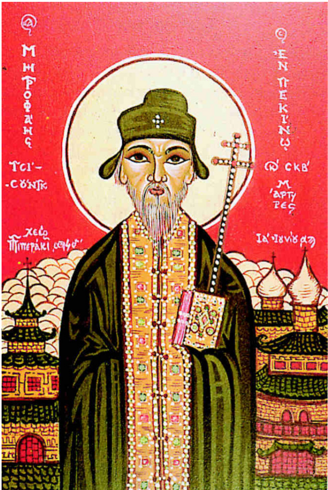
Άγιος Μητροφάνης Τσί-Σούγκ