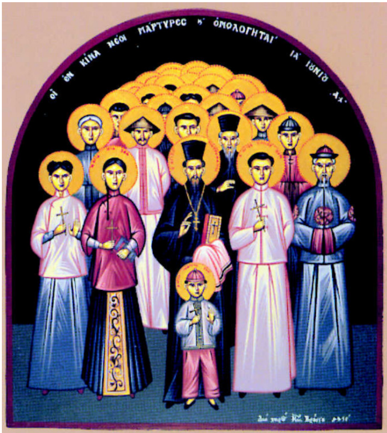
Άγιος Μητροφάνης Τσί-Σούνγκ και οι μαζί μ' αυτόν μαρτυρήσαντες: Τατιανή η Πρεσβυτέρα του, Ησαΐας και Ιωάννης οι γιοι του, Μαρία η νύφη του, Αγία Ια η διδασκάλισσα και άλλοι 222 Κινέζοι Μάρτυρες