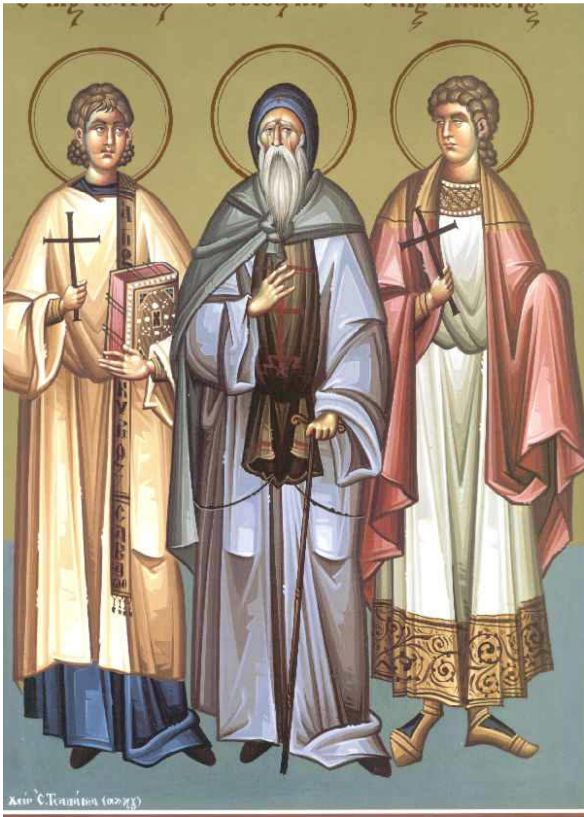
Ἅγιοι Μανουήλ, Σαβέλ και Ισμαήλ