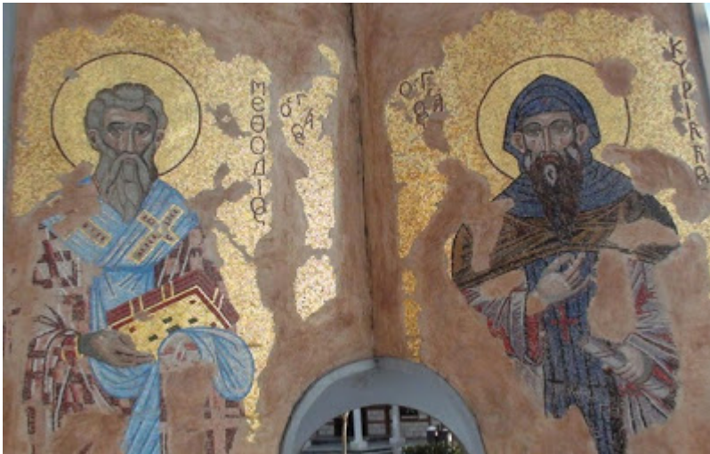
Οι Άγιοι Κύριλλος και Μεθόδιος σε

ψηφιδωτό στον προαύλιο χώρο του Ιερού Ναού προς τιμήν τους στην Παραλία Θεσσαλονίκης