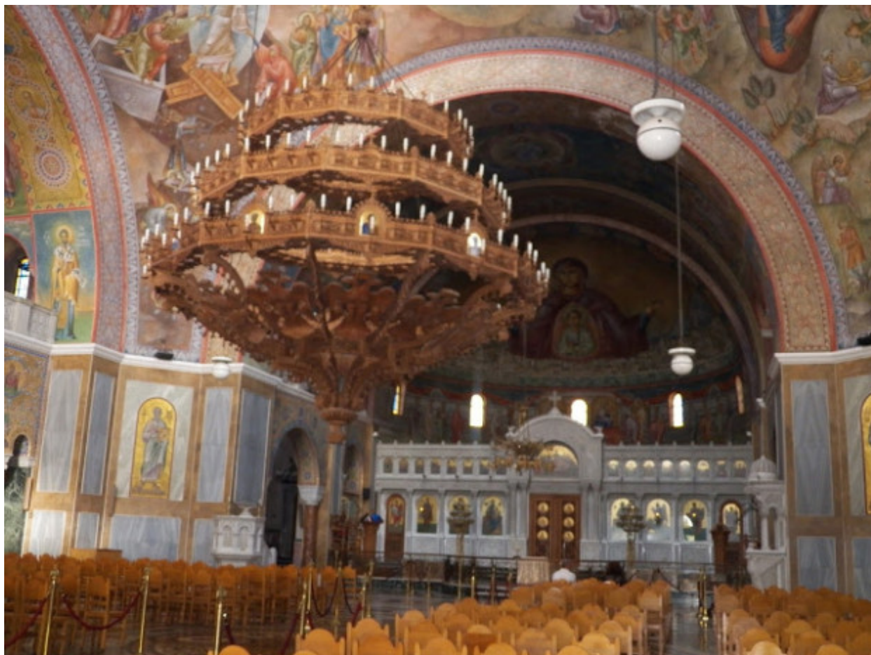
Εκ του Ιερού Ναού