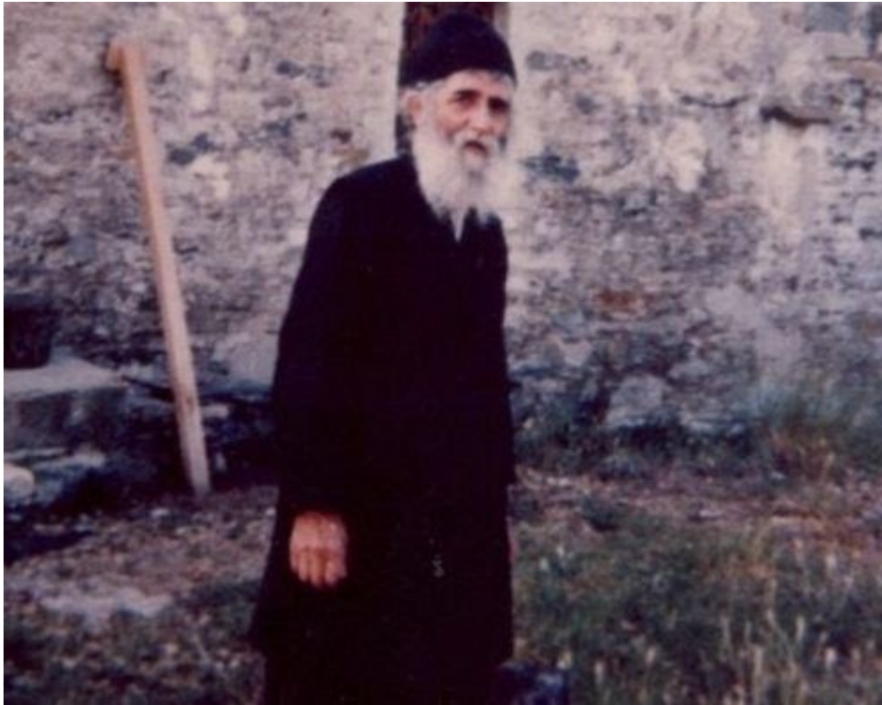
Με λαμπρότητα θα

τιμηθεί η εορτή του Αγίου Παΐσιου στην Κόνιτσα, στο μέρος που γαλουχήθηκε.