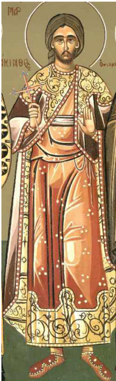
Άγιος Υάκινθος ο κουβικουλάριος (θαλαμηπόλος)