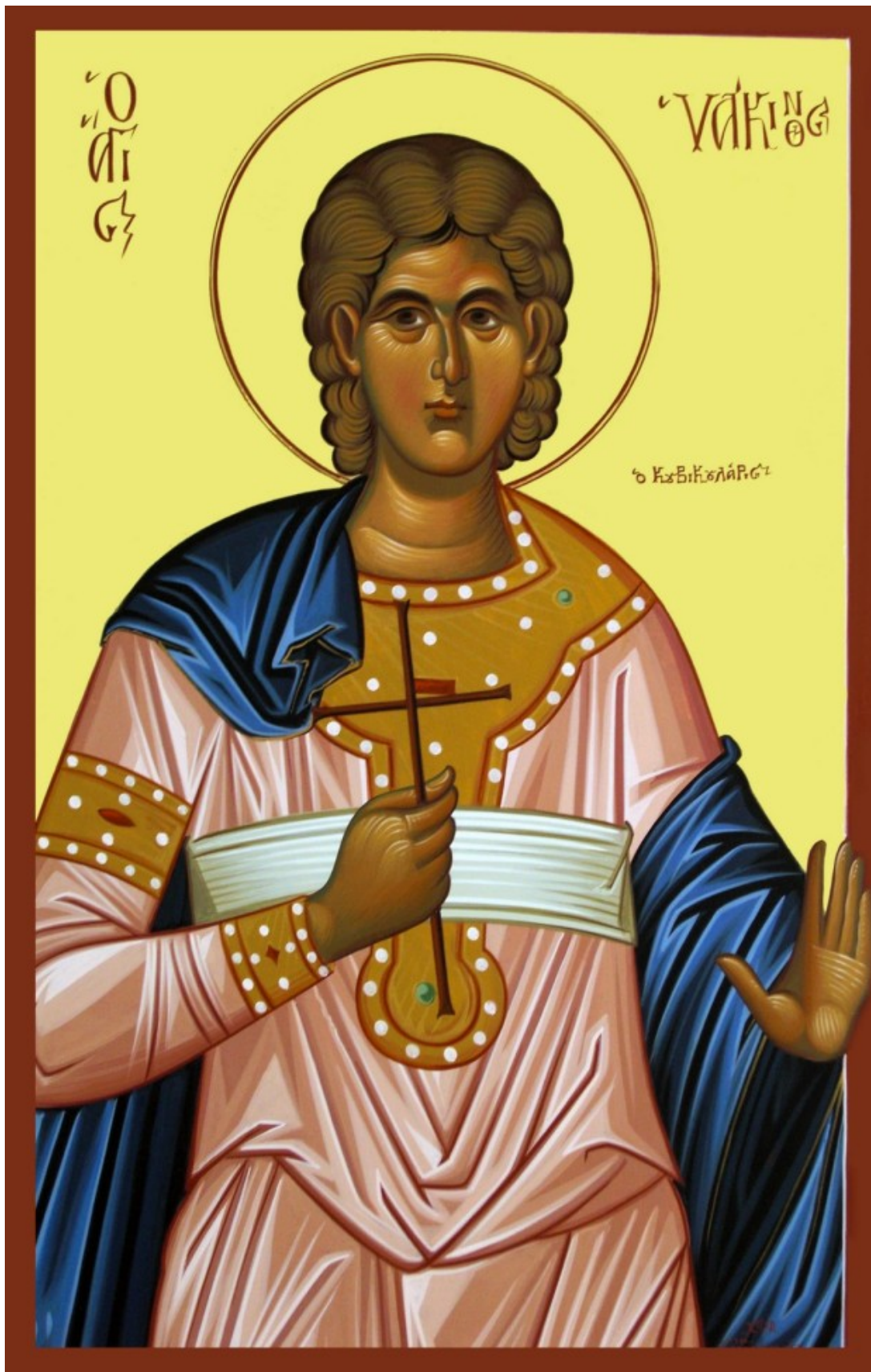
Άγιος Υάκινθος ο κουβικουλάριος (θαλαμηπόλος)