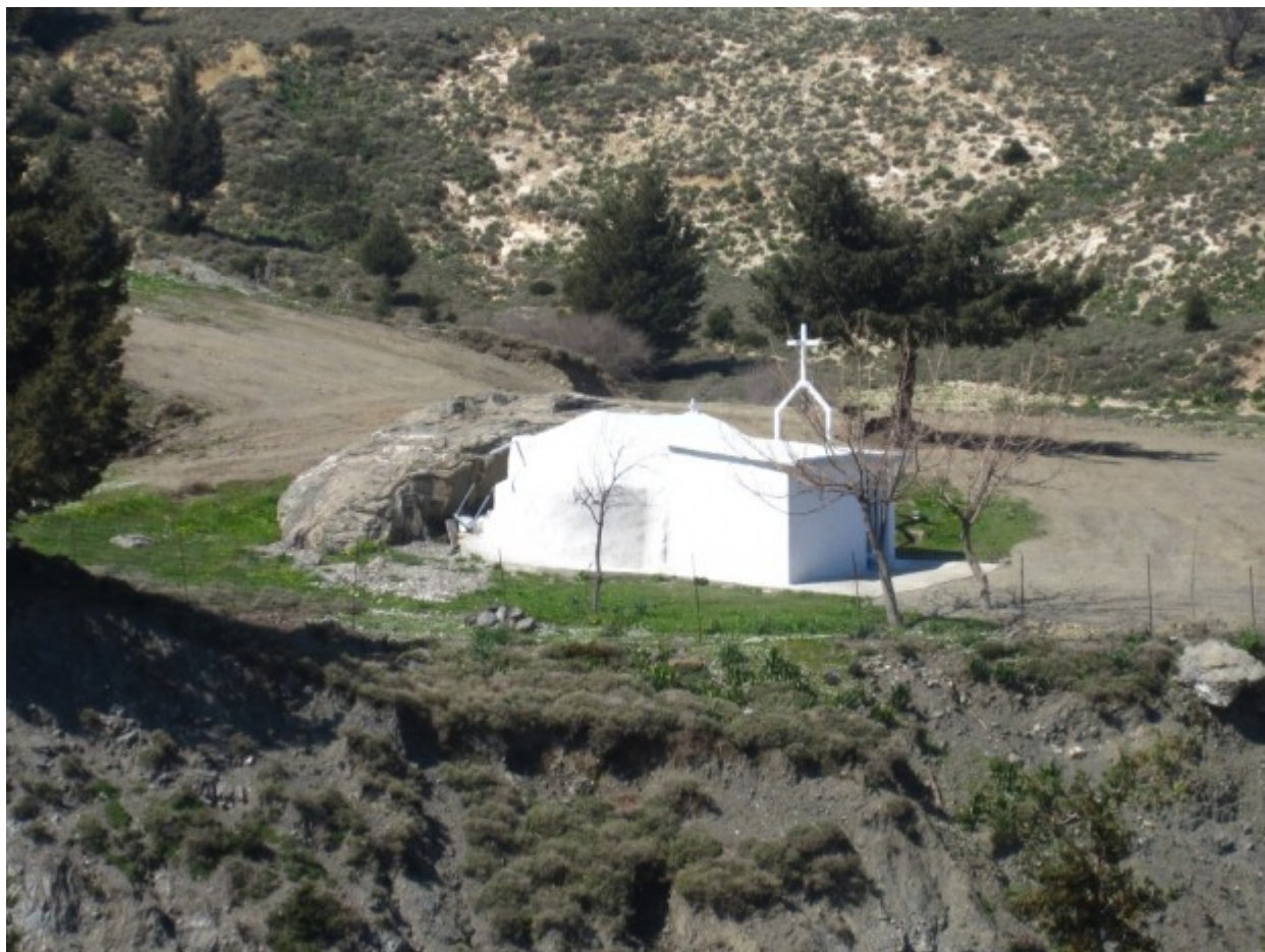
Το εκκλησάκι της Οσίας Μελούς από τα ανατολικά, τη θέση Κοκκινόνερο