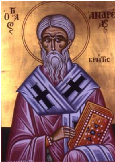
Άγιος Ανδρέας ο Ιεροσολυμίτης Αρχιεπίσκοπος Κρήτης

Κουδουμά, δια χειρός Παναγιώτη Μόσχου (2006 μ.Χ.)