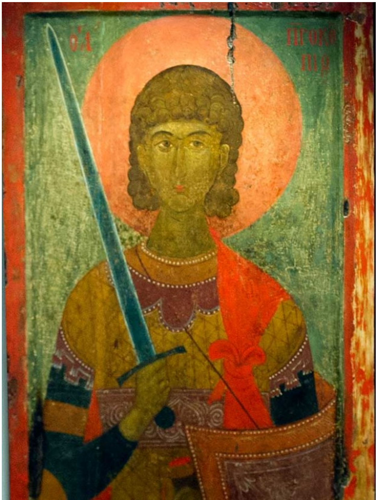
Άγιος Προκόπιος ο Μεγαλομάρτυς