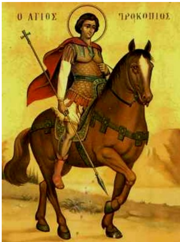
Άγιος Προκόπιος ο Μεγαλομάρτυς