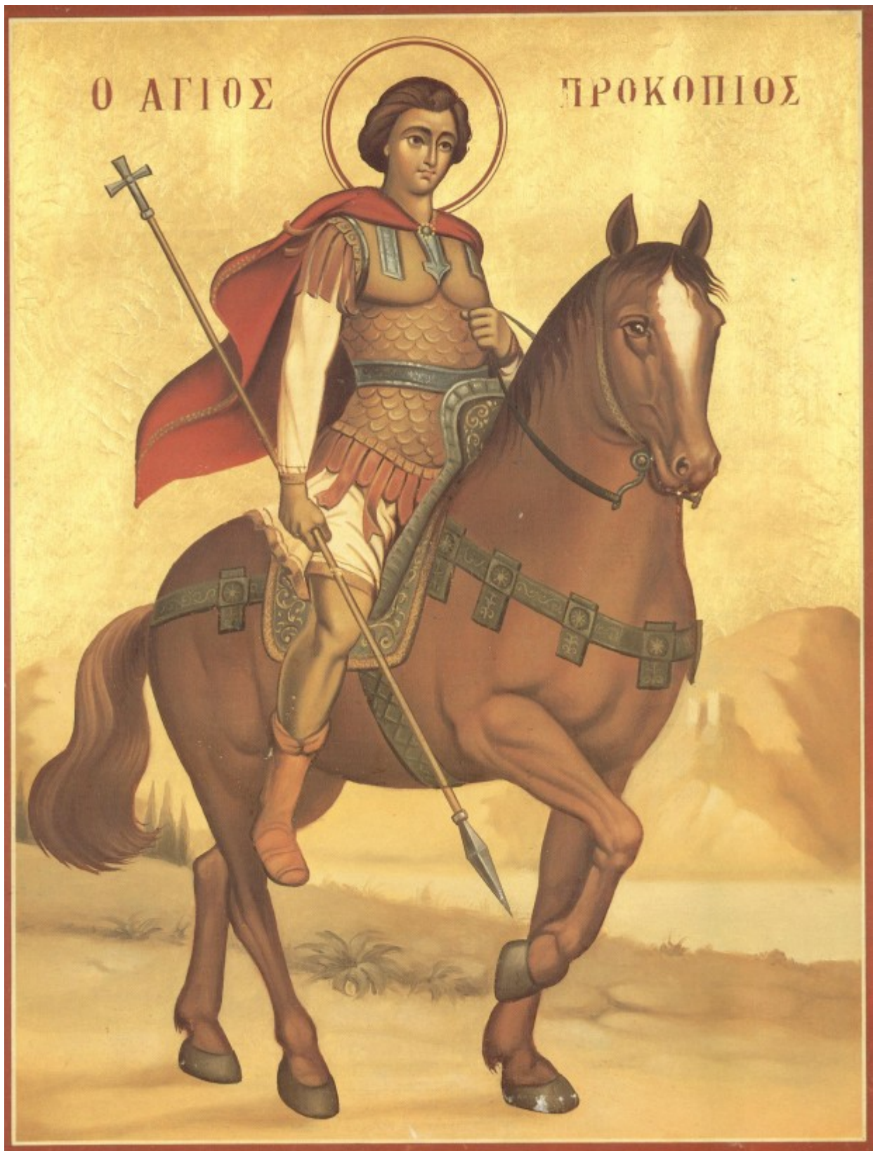
Άγιος Προκόπιος ο Μεγαλομάρτυς