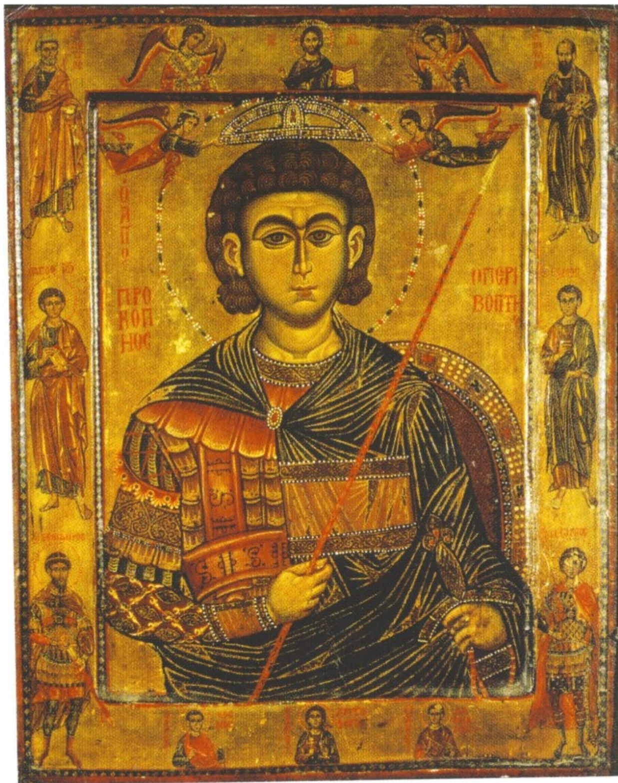
Άγιος Προκόπιος ο Μεγαλομάρτυς