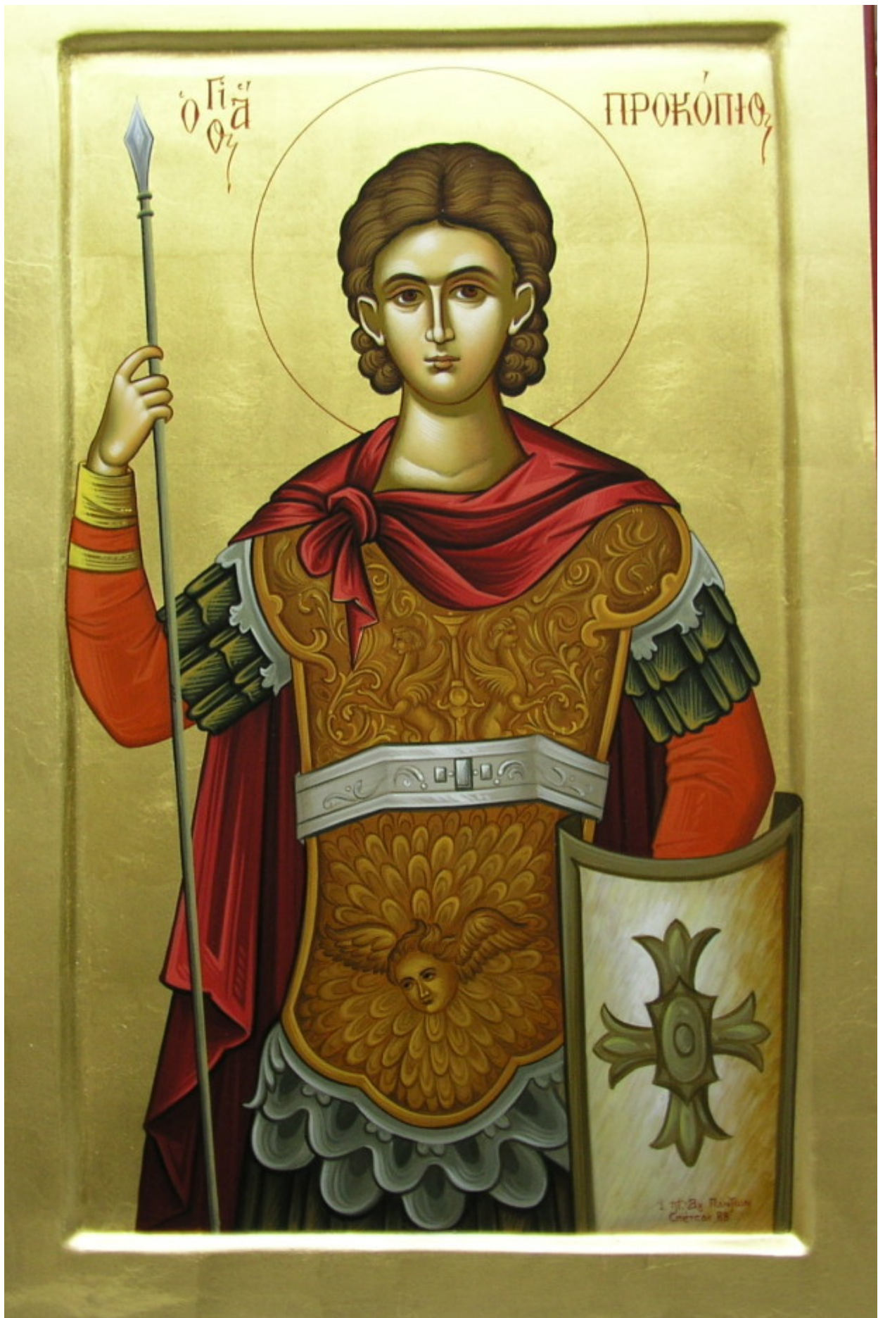
Άγιος Προκόπιος ο Μεγαλομάρτυς