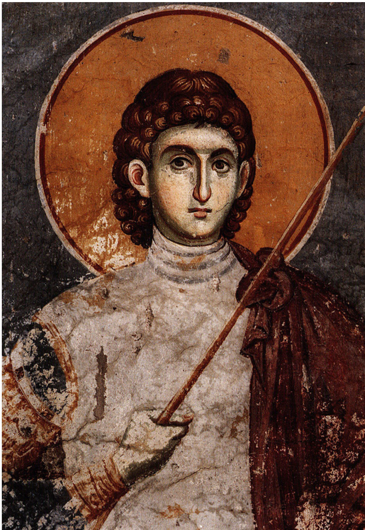
Άγιος Προκόπιος ο Μεγαλομάρτυς