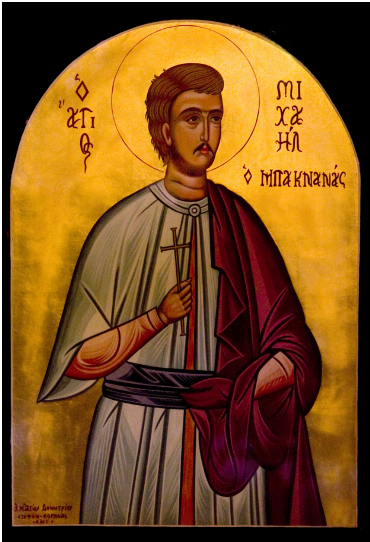
Το μαρτύριο του Αγίου Μιχαήλ Πακκανά