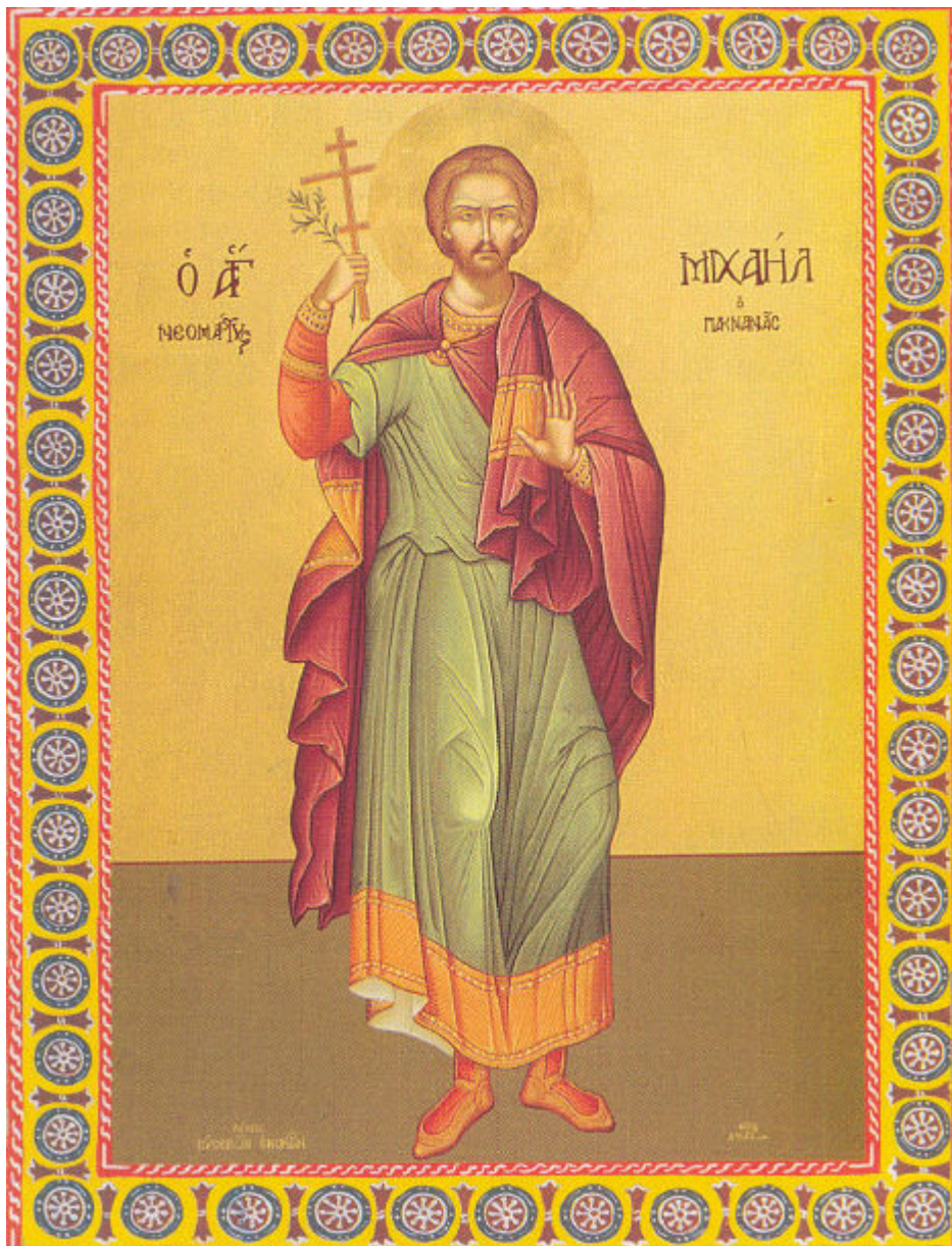
Το μαρτύριο του Αγίου Μιχαήλ Πακνανά