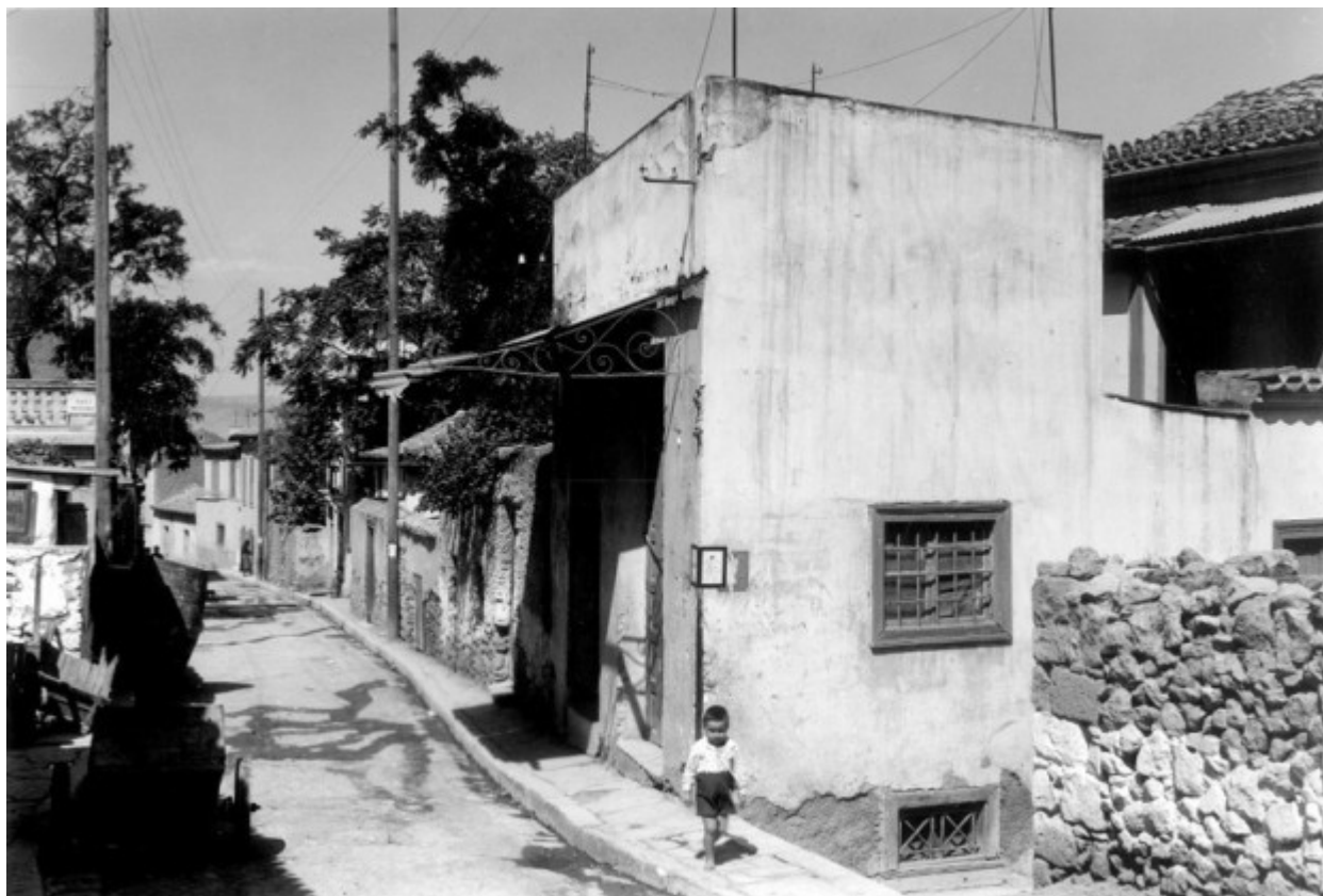
Το σπίτι του Αγίου Μιχαήλ του Πακνανά στην παλιά αθηναϊκή συνοικία της Βλασσαρούς (1935 μ.Χ.)