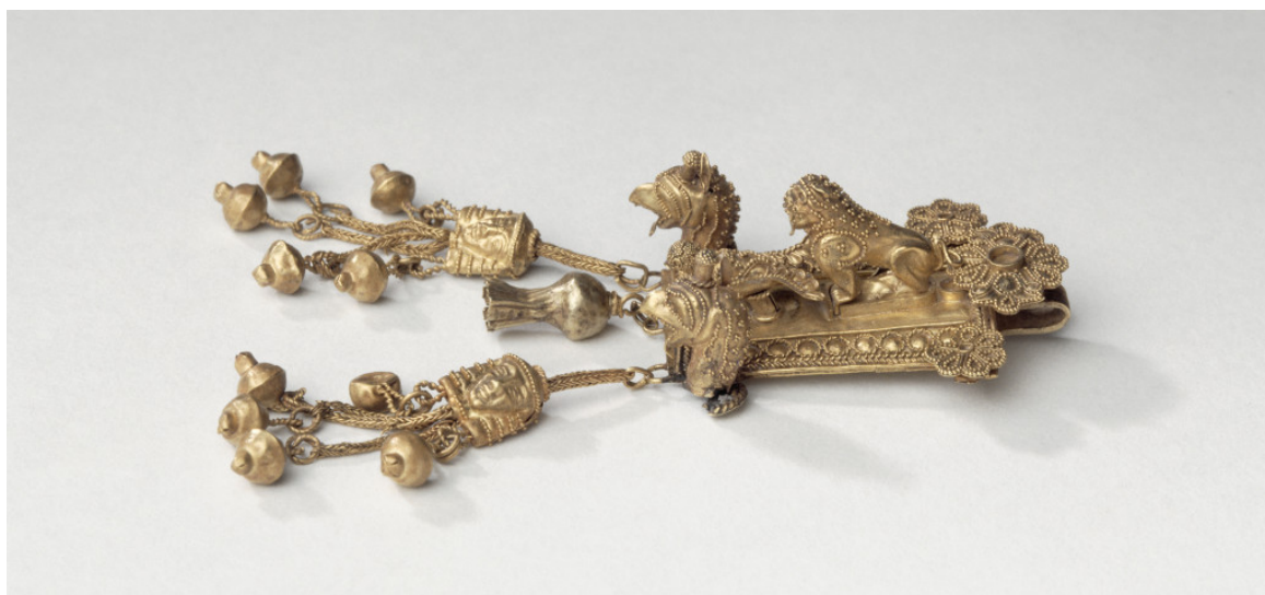
Πλακίδιο από κράμα χρυσού και αργυρού. Αποτελούσε στοιχείο περιδεραίου ή ήταν επιρραμμένο σε ένδυμα. Λιοντάρι επιτίθεται σε αετό. 650-600 π.Χ. Βρέθηκε στις ανασκαφές του 19ου αι. σε τάφο της Καμίρου μαζί με άλλα κοσμήματα. Μουσείο Λούβρου, Συλλογή Ελληνικών, Ετρουσκικών και Ρωμαϊκών Αρχαιοτήτων

Η έκθεση, όπως και αυτή στο Λούβρο, έχει τρεις θεματικούς άξονες: ο πρώτος αναφέρεται στην αρχαιολογική έρευνα του νησιού, ο δεύτερος στο ρόλο της Ρόδου ως τόπου ανταλλαγών και ο τρίτος στα ροδιακά εργαστήρια. Τα εκθέματα που θα πλαισιώσουν τις θεματικές ενότητες προέρχονται από το Μουσείο του Λούβρου και από το Αρχαιολογικό Μουσείο της Ρόδου. Τα εκθέματα από τα άλλα ευρωπαϊκά μουσεία θα αντικατασταθούν από παρόμοια στο Μουσείο της Ρόδου, ενώ συνέχεια της έκθεσης, αποτελούν ουσιαστικά και οι υπόλοιπες συλλογές του Αρχαιολογικού Μουσείου. Το Μουσείο του Λούβρου αποστέλλει στη Ρόδο συνολικά 48 ευρήματα: α) μυκηναϊκό ρυτό με παράσταση χταποδιού, το οποίο και αποτέλεσε έμβλημα της έκθεσης στο Λούβρο, β) ταφικό σύνολο (τάφος Α) από την Κάμιρο, με πολυάριθμα αγγεία και αντικείμενα, εισηγμένα από την Ανατολή και γ) 15 κοσμήματα από ήλεκτρο (φυσικό κράμα χρυσού και αργύρου), αριστουργηματικά δείγματα της ροδιακής χρυσοχοΐας των αρχαϊκών χρόνων (7ος αι. π.Χ.).