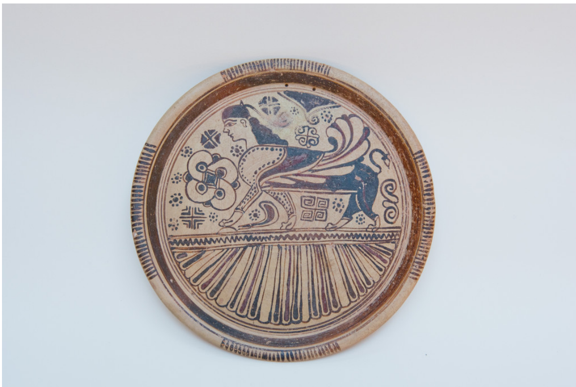
Πινάκιο του ρυθμού των Αιγάγων. 600-570 π.Χ. Προέρχεται πιθανώς από τη Νίσυρο. Βρέθηκε σε τάφο της Καμίρου. Αρχαιολογικό Μουσείο Ρόδου

Την ιδιαίτερη σημασία της Ρόδου ως πύλης προς την Ανατολή, έτσι όπως αναδείχθηκε από την αρχαιολογική έρευνα, προβάλλει η νέα έκθεση του Αρχαιολογικού Μουσείου της Ρόδου. Η έκθεση, αποτελεί μεταφορά στη Ρόδο μέρους της έκθεσης που πραγματοποιήθηκε στο μουσείο του Λούβρου, από το Νοέμβριο τού 2014 έως τον Φεβρουάριο τού 2015. Η έκθεση του Λούβρου συνένωσε για πρώτη φορά στον ίδιο χώρο, ευρήματα από διάφορα ευρωπαϊκά μουσεία, του Λούβρου, της Ρόδου, το Βρετανικό και το μουσείο της Κοπεγχάγης, ευρήματα που προέρχονται από ανασκαφές, οι οποίες πραγματοποιήθηκαν στη Ρόδο από τον 19ο αι. έως και σήμερα.