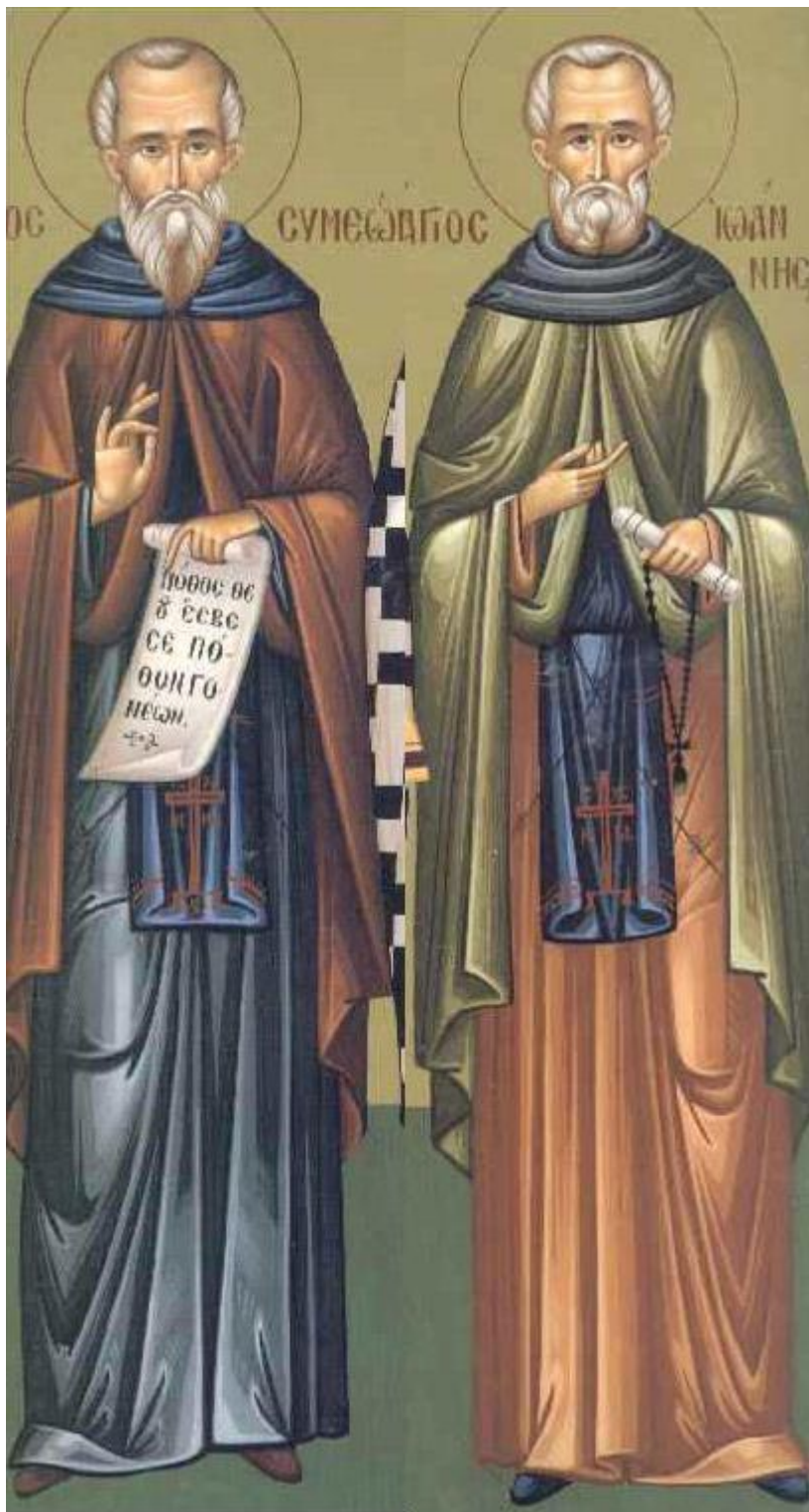
Ἅγιοι Συμεών ὁ δια Χριστόν σαλός καὶ Ἰωάννης