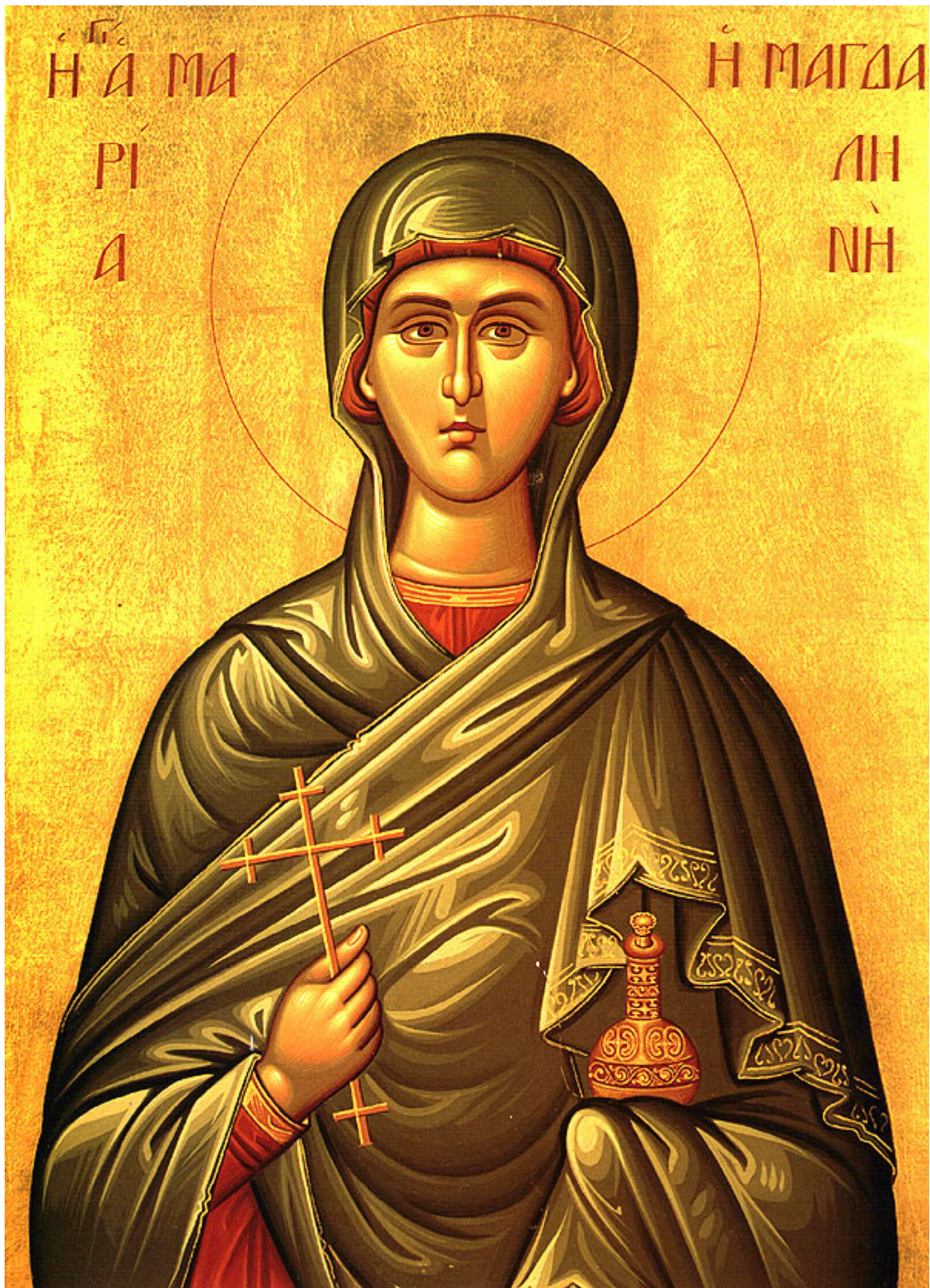
Αγία Μαρία η Μαγδαληνή η Μυροφόρος και Ισαπόστολος