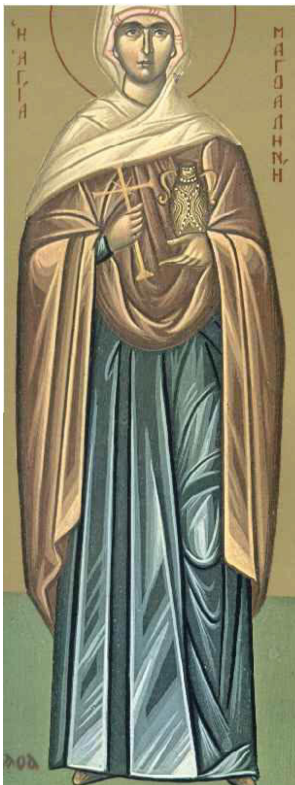
Αγία Μαρία η Μαγδαληνή η Μυροφόρος και Ισαπόστολος