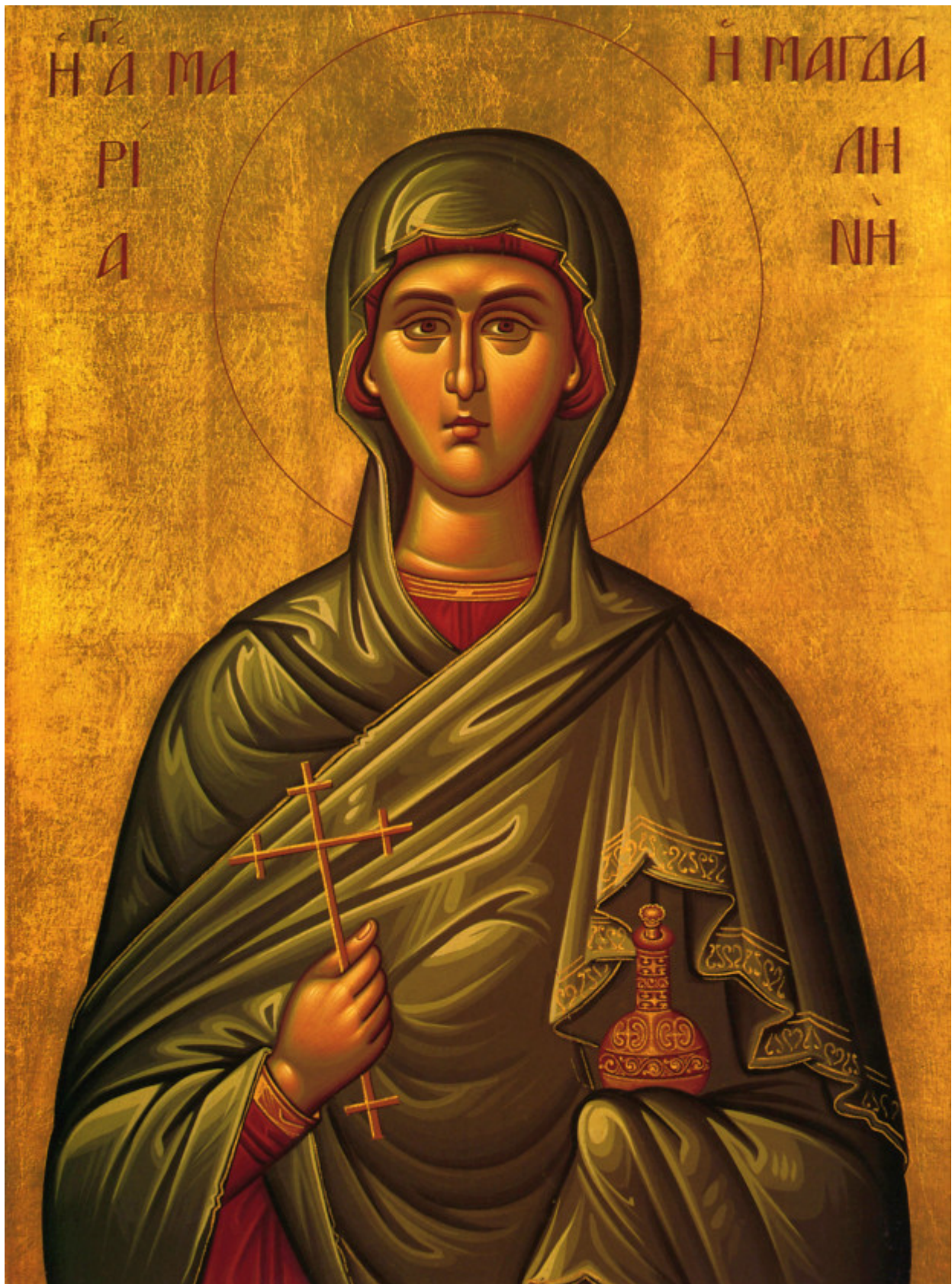
Αγία Μαρία η Μαγδαληνή η Μυροφόρος και Ισαπόστολος